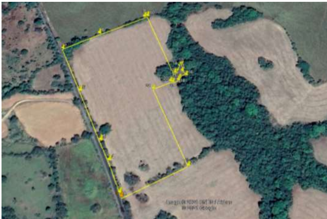
Figura N° 5.1 Localización del Proyecto “RESIDENCIAL VILLA DE LAS FLORES”