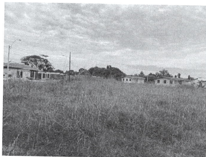
Fig. 3 y 4: área propuesta del proyecto y vegetación existente