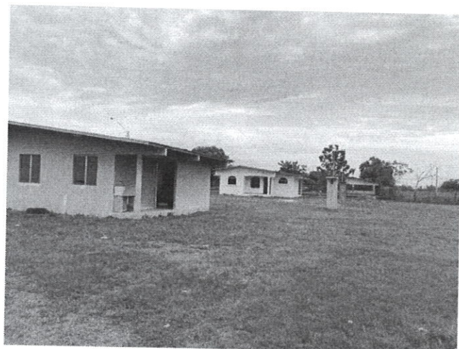
Fig. 1 y 2: Casas construidas dentro del área del proyecto propuesta