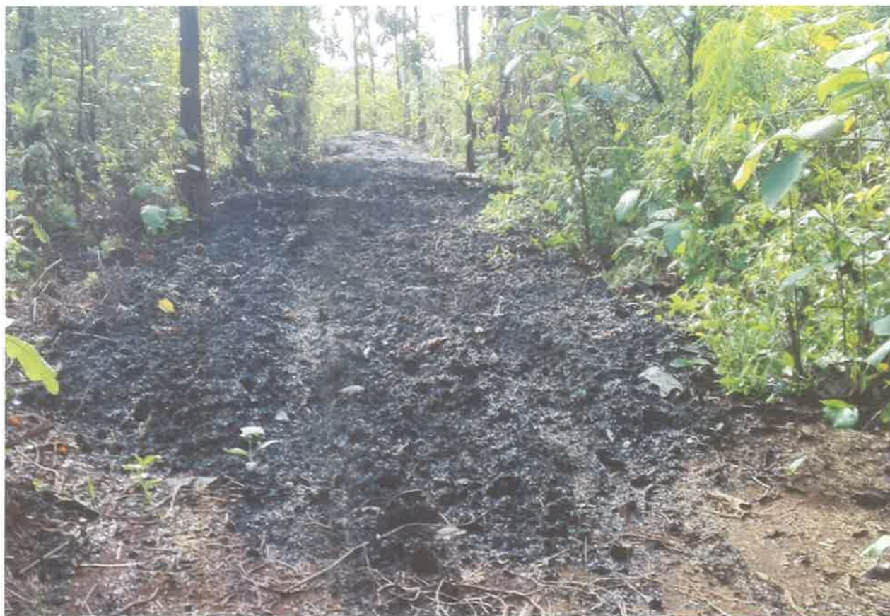
Fig. 1 Depósito presumiblemente ilegal de pulpa de café en la comunidad de Dos ríos a unos cuantos metros de la Quebrada Grande.