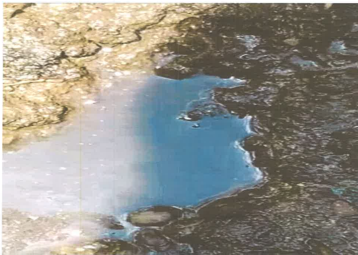
Fig. 2 Lixiviado de la pulpa de café en la comunidad de Dos ríos que por la lluvia es arrastrado hacia la Quebrada Grande.