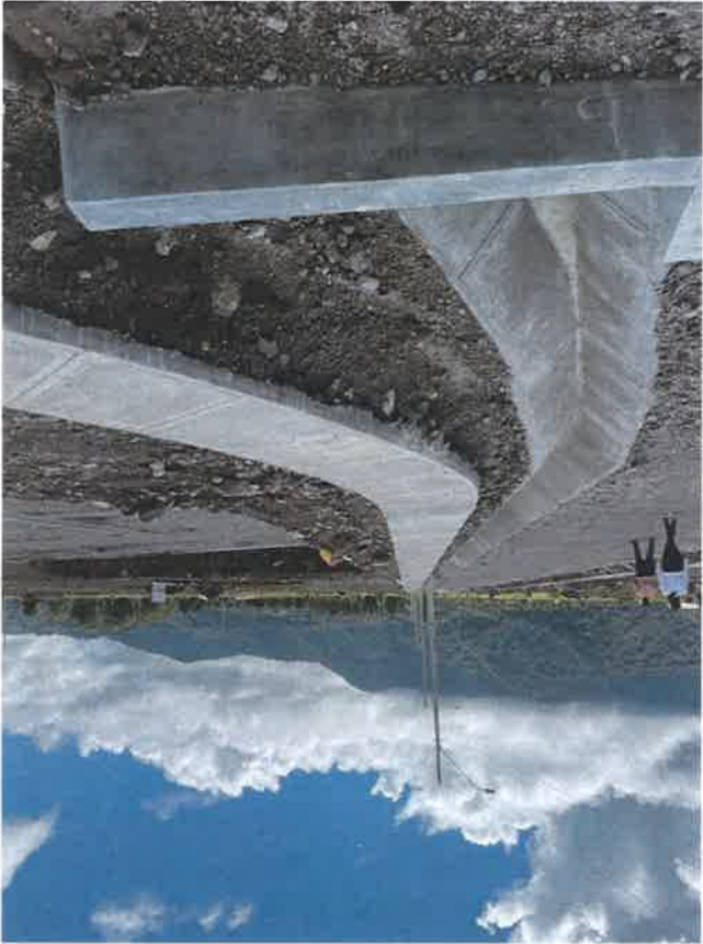
Cunetas, aceras, tendido eléctrico