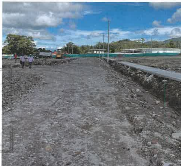
Conformación de calles

"En virtud al Decreto Ejecutivo No.285, del 28 de mayo de 2021, que reglamenta la Ley 81 del 26 de marzo de 2019 "Sobre la protección de Datos Personales", los datos personales proporcionados en el presente documento están protegidos y son de carácter confidencial."