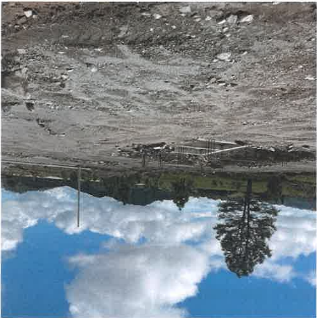
Fundaciones del tanque de agua