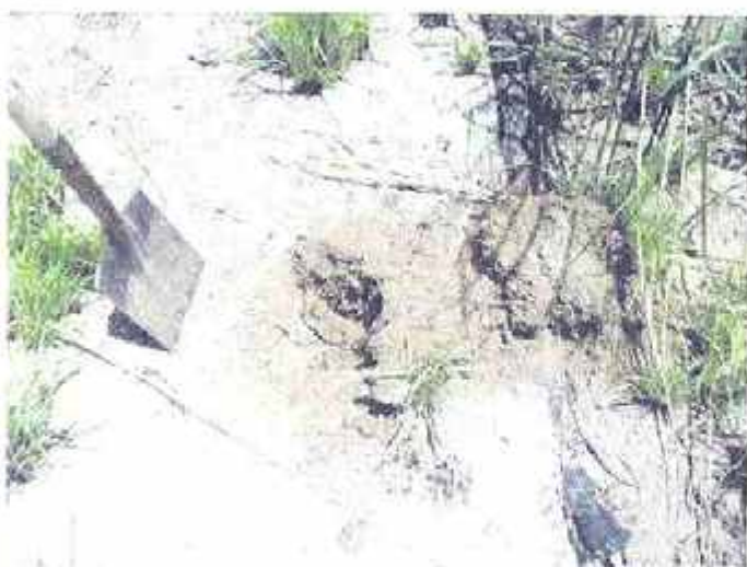
Vistas de sondeos típicos en el suelo arenoso. Los resultados fueron negativos.