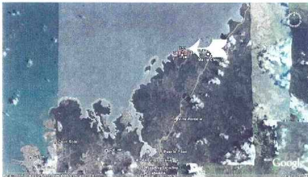
Ubicación del globo de terreno donde se propone llevar a cabo el proyecto.

Se trata de un globo de terreno ubicado al oeste de la comunidad de María Chiquita (Distrito de Portobelo, Colón), donde se propone un desarrollo turístico. Se trata de un terreno con excelente visibilidad y la prospección arrojó resultados negativos, por lo que se concluye que el proyecto no afectará los recursos arqueológicos del Patrimonio Histórico de la Nación y no será necesario implementar medidas de mitigación al respecto. Se recomienda reportar cualquier hallazgo fortuito ante la DNPH-INAC.