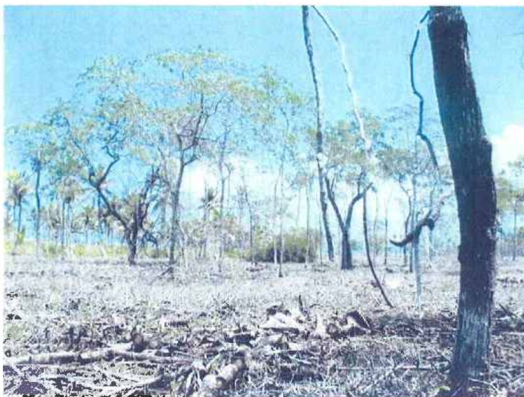
Estado actual de la propiedad.