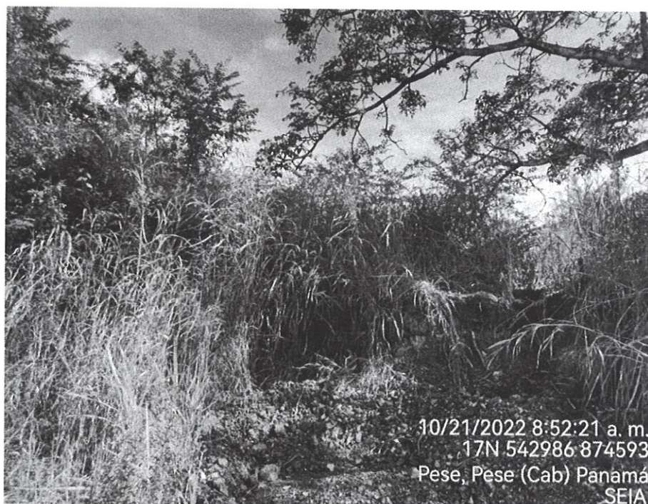
Fotografía N° 2. Se observa extracción de material selecto (tosca).