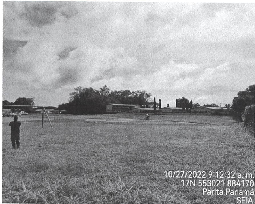
Fotografía N° 2. Otra sección del terreno y al fondo el Centro de Educación Básica de Parita.