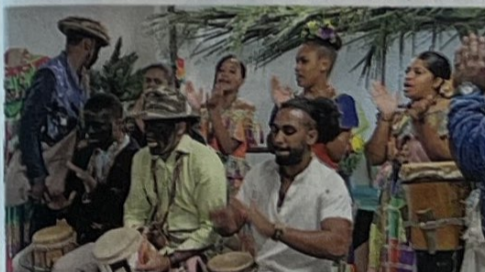
'Colón experience' incluye la presentación de bailes congo.