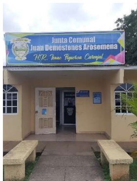
Tabla 6. Evidencia de las vistas a las Juntas Comunales de los corregimientos Juan Demóstenes Arosemena y Nuevo Emperador