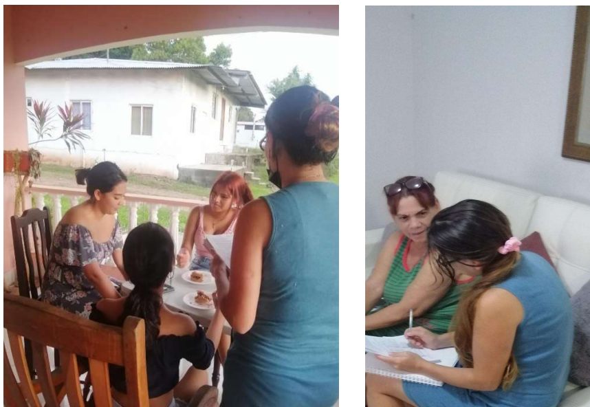
Tabla 5. Registro Fotográfico de aplicación de encuestas.

En la Tabla 6 se presenta las evidencias fotográficas de las visitas realizadas a las Juntas Comunales de los corregimientos Juan Demóstenes Arosemena y Nuevo Emperador, presentado en el estudio de impacto ambiental.