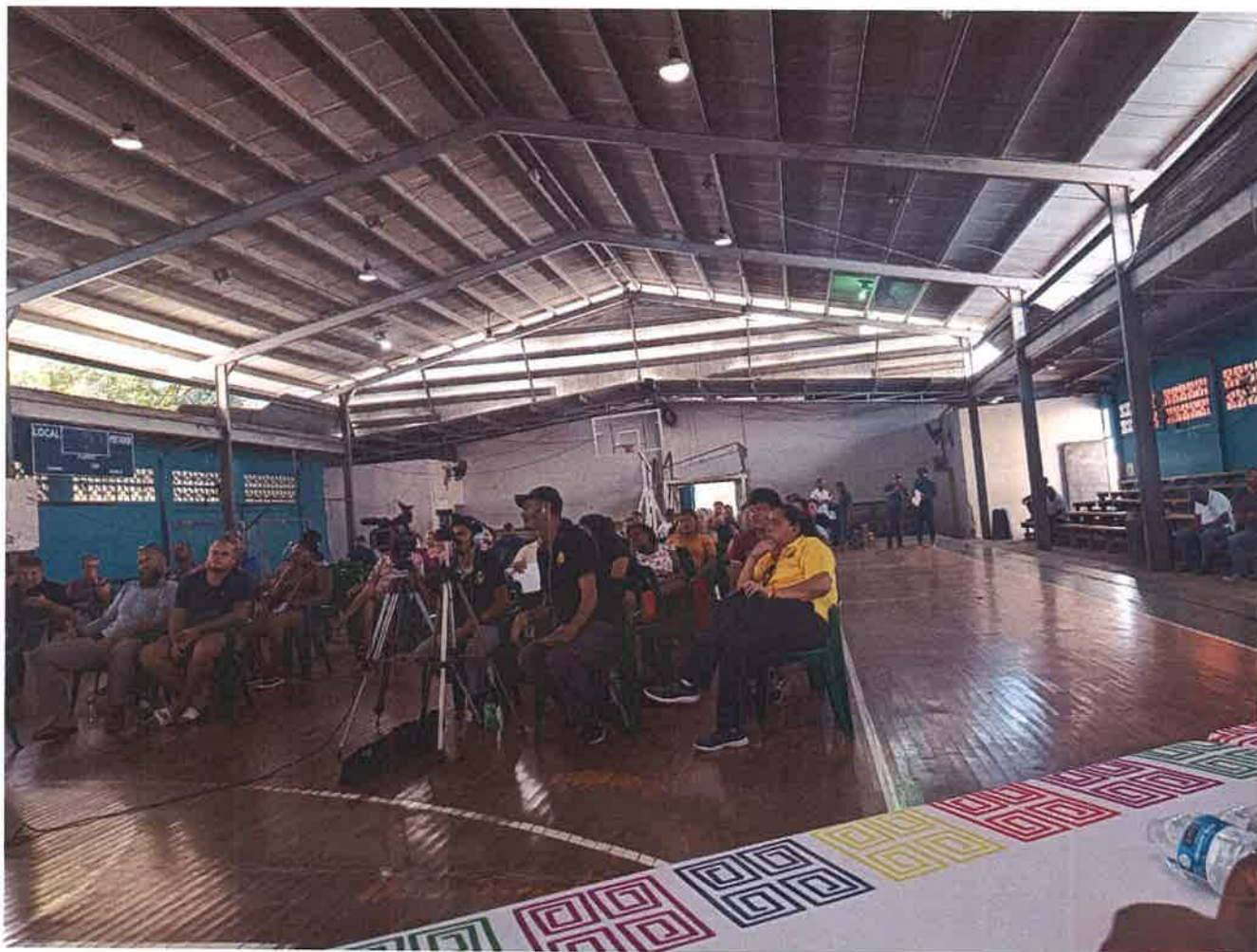
Figura 1. Participantes que asistieron al Foro.