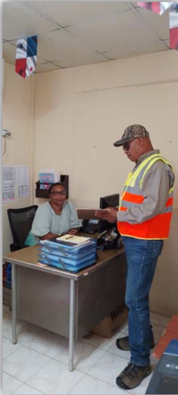
Imágenes 8.1 De la aplicación del sondeo de opinión