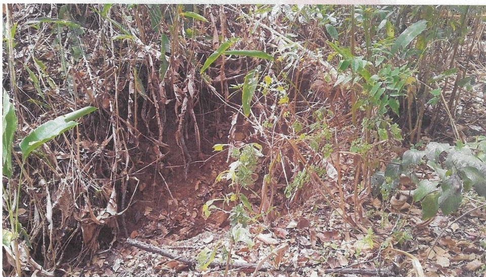
Inspección del sitio, canal pluvial (se registró seco)