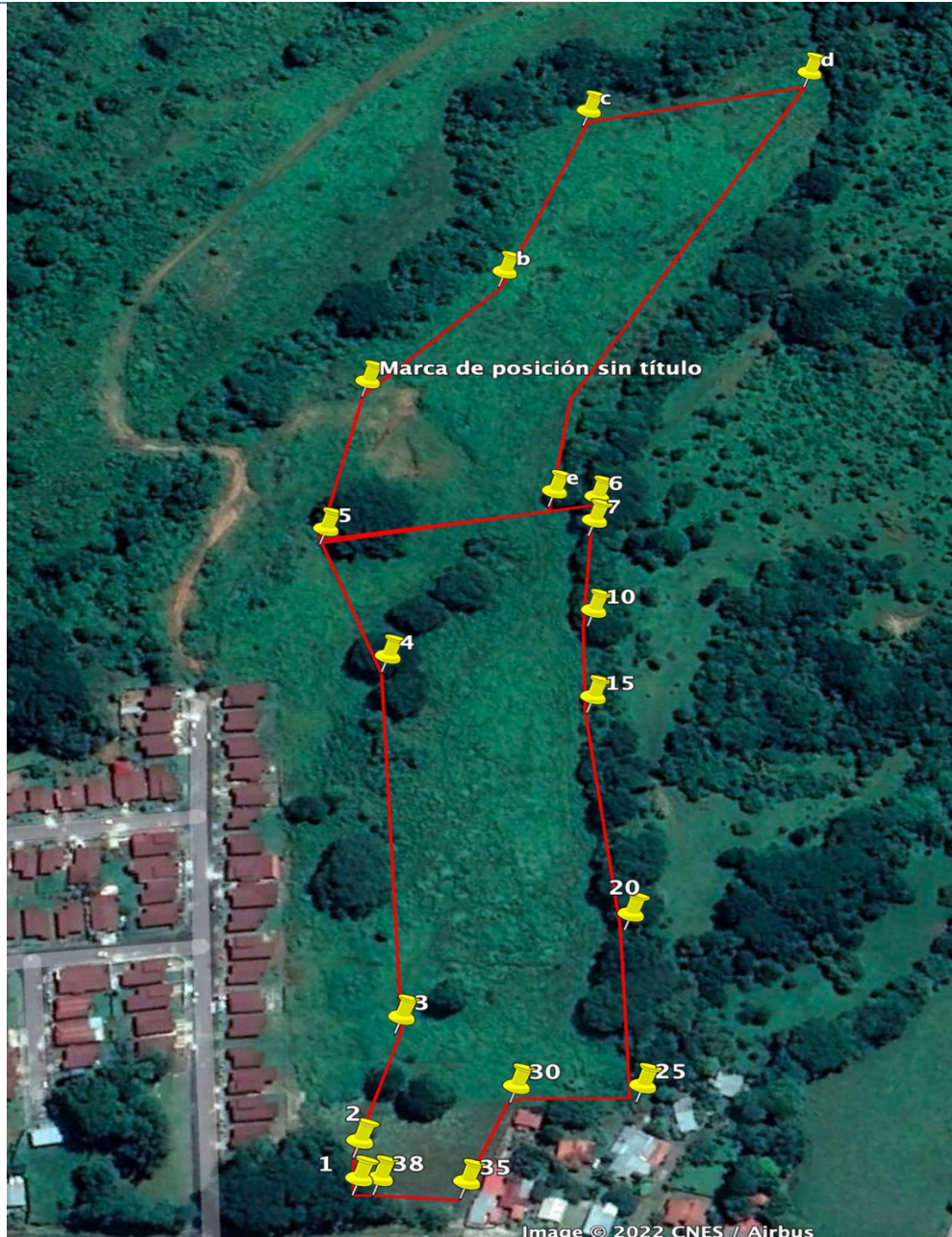
Ilustración 2. Vista del terreno a desarrollar

Tal como se ve en la imagen satelital, la zona se encuentra recubierta principalmente por gramíneas.