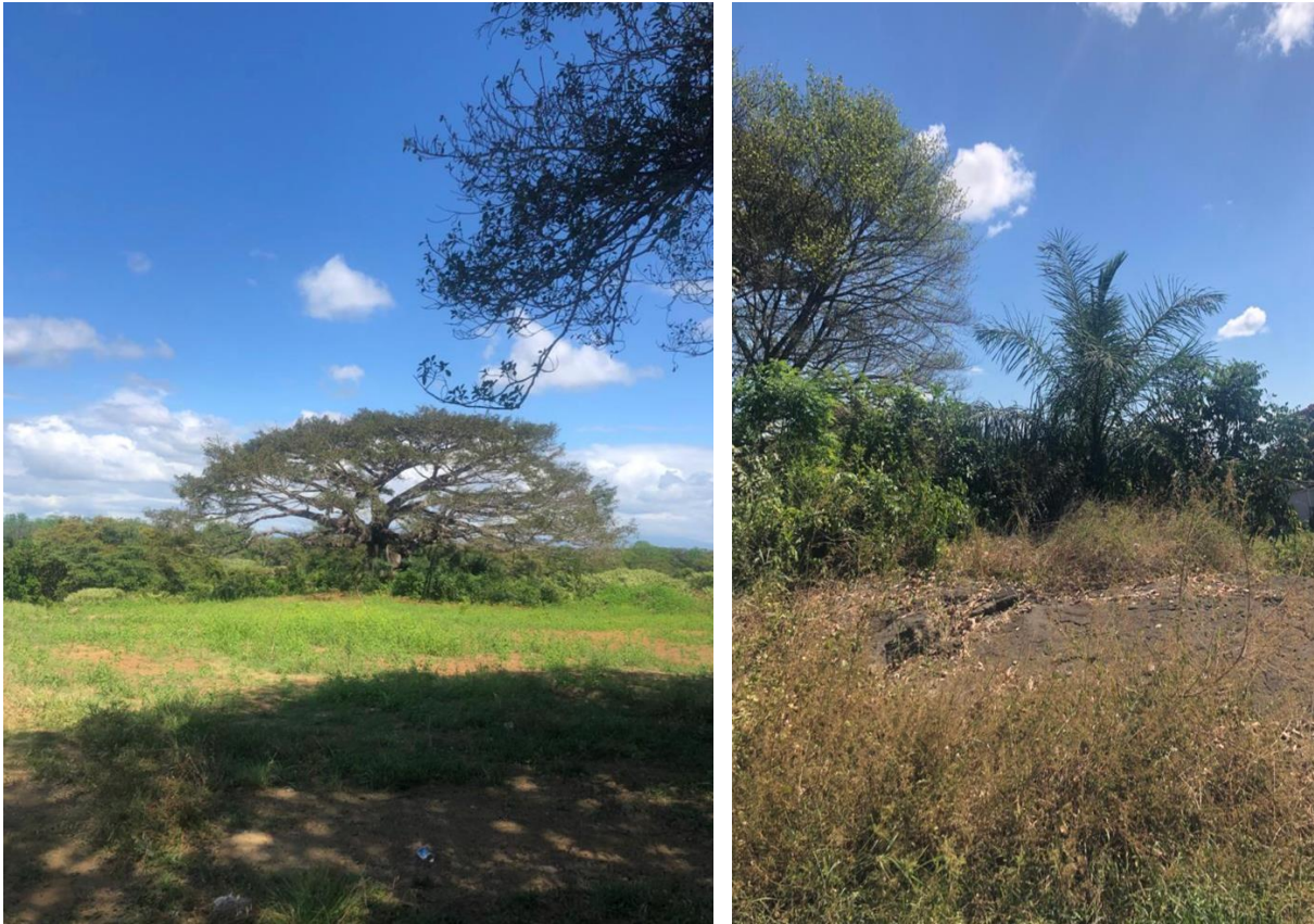
Ilustración No. 4. Vista de la zona a intervenir