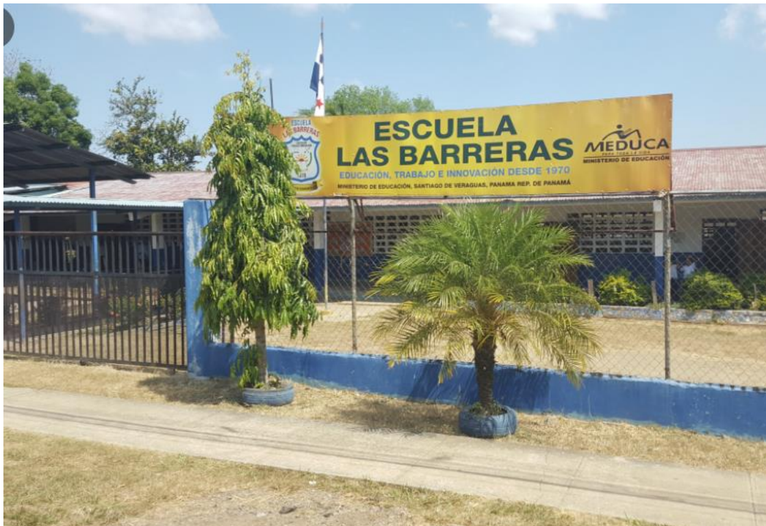
Ilustración 9. Vista de la escuela del lugar.

Los terrenos del promotor, y las fincas vecinas no escapan de esta realidad; el polígono en donde se ha delimitado el proyecto, tiene puntos con elevaciones bajas. El terreno a desarrollar podría describirse como una planicie que favorece las intenciones del desarrollo.