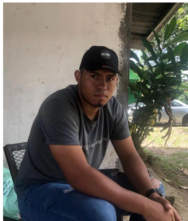
Ilustración No. 8 Julio Cruz