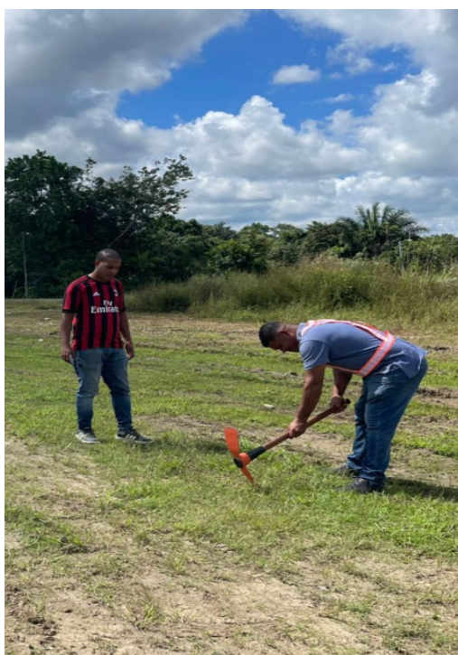
Imágenes de toma en campo