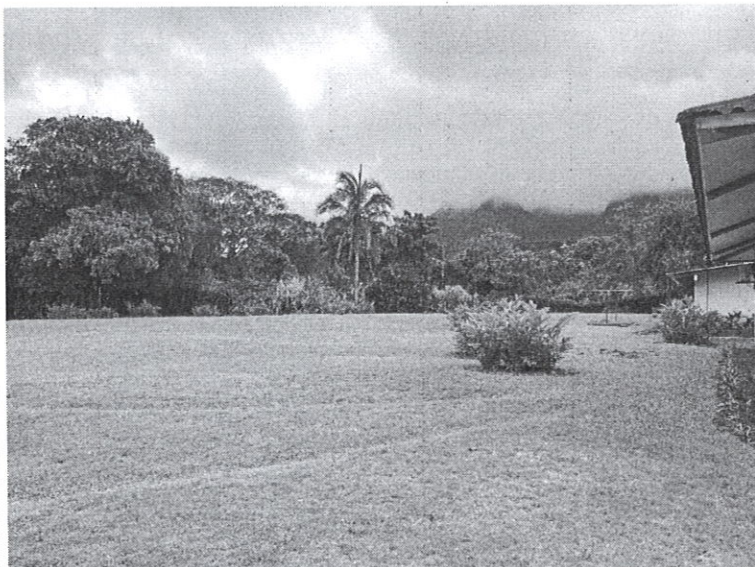
Fig. 2 y 3: vegetación existente en el área