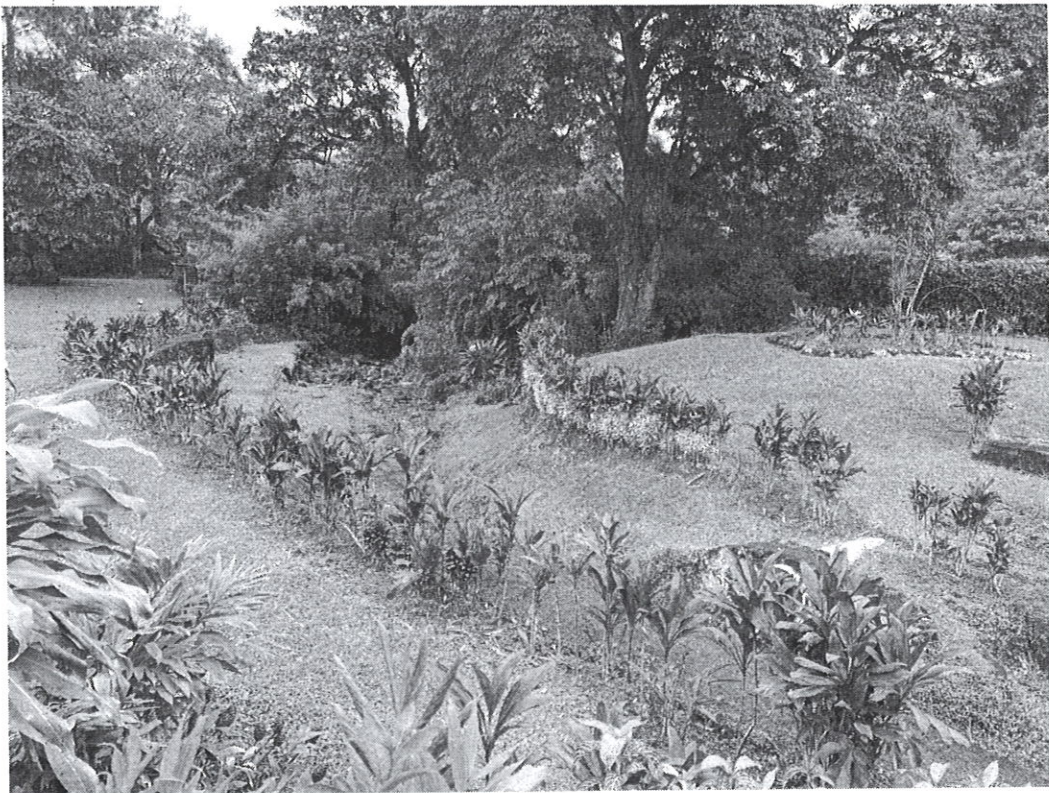
Fig. 4: parte frontal de la propiedad que colinda con la quebrada Los Robles