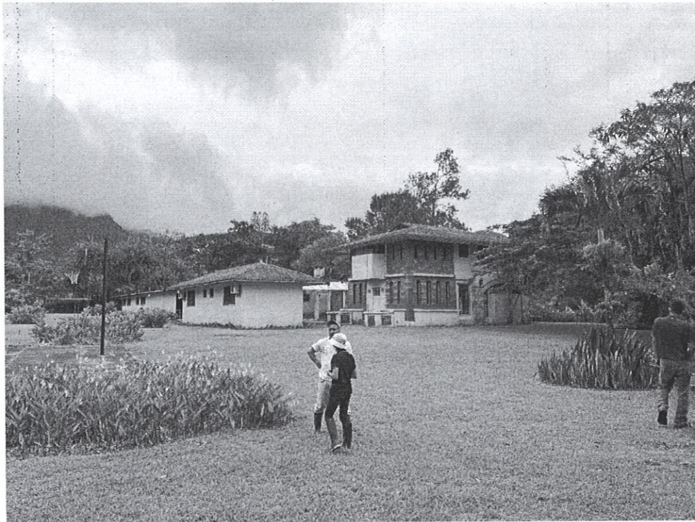
Fig. 1: casa existente en el área del proyecto