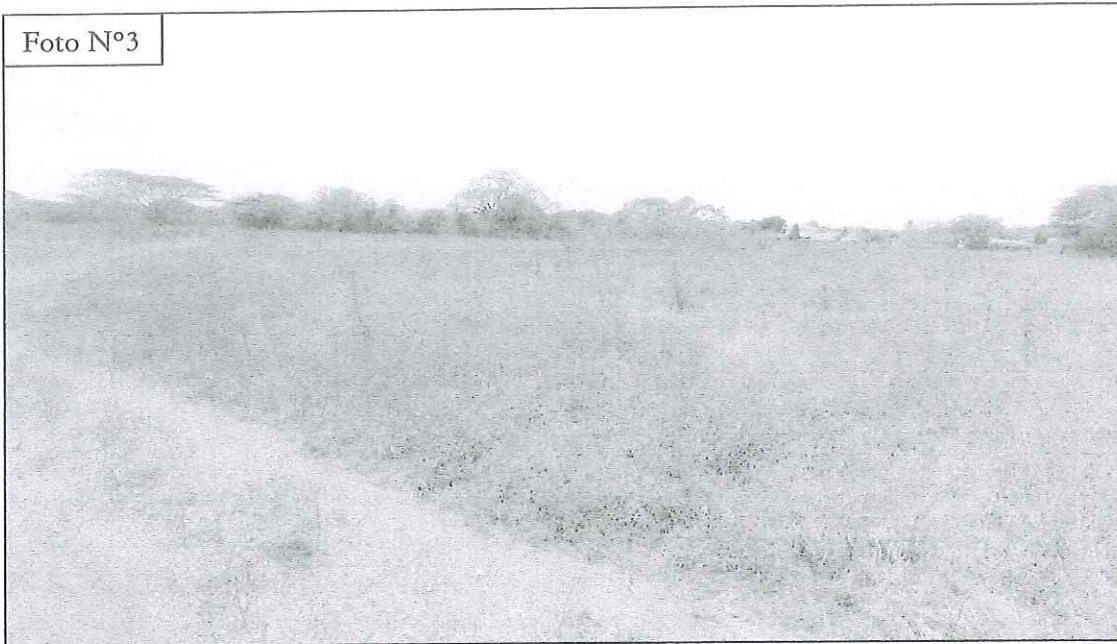
FOTO N°3: Se observa la topografía y vegetación del terreno dentro del polígono a desarrollar.