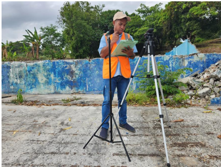
Punto # 1: DENTRO DEL POLÍGONO DEL PROYECTO