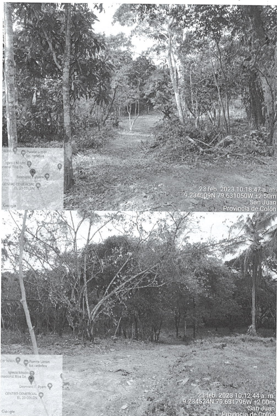
Foto del lugar donde se desarrollara el Proyecto