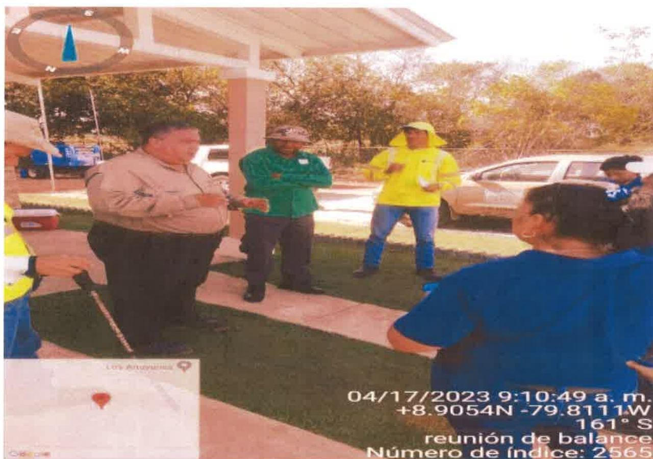
Reunión de balance en sitio: Corregimiento de Herrera Distrito Chorrera, Provincia de Panamá Oeste EIA categoría II, "DESARROLLO RESIDENCIAL LAS YAYAS"