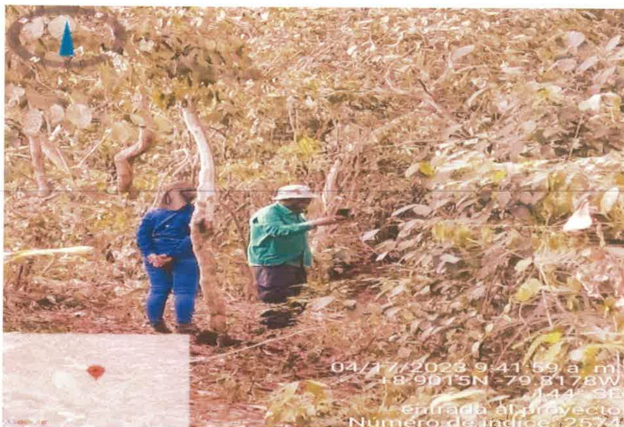
Recorrido por el polígono en la gira anterior RESIDENCIAL LAS YAYAS