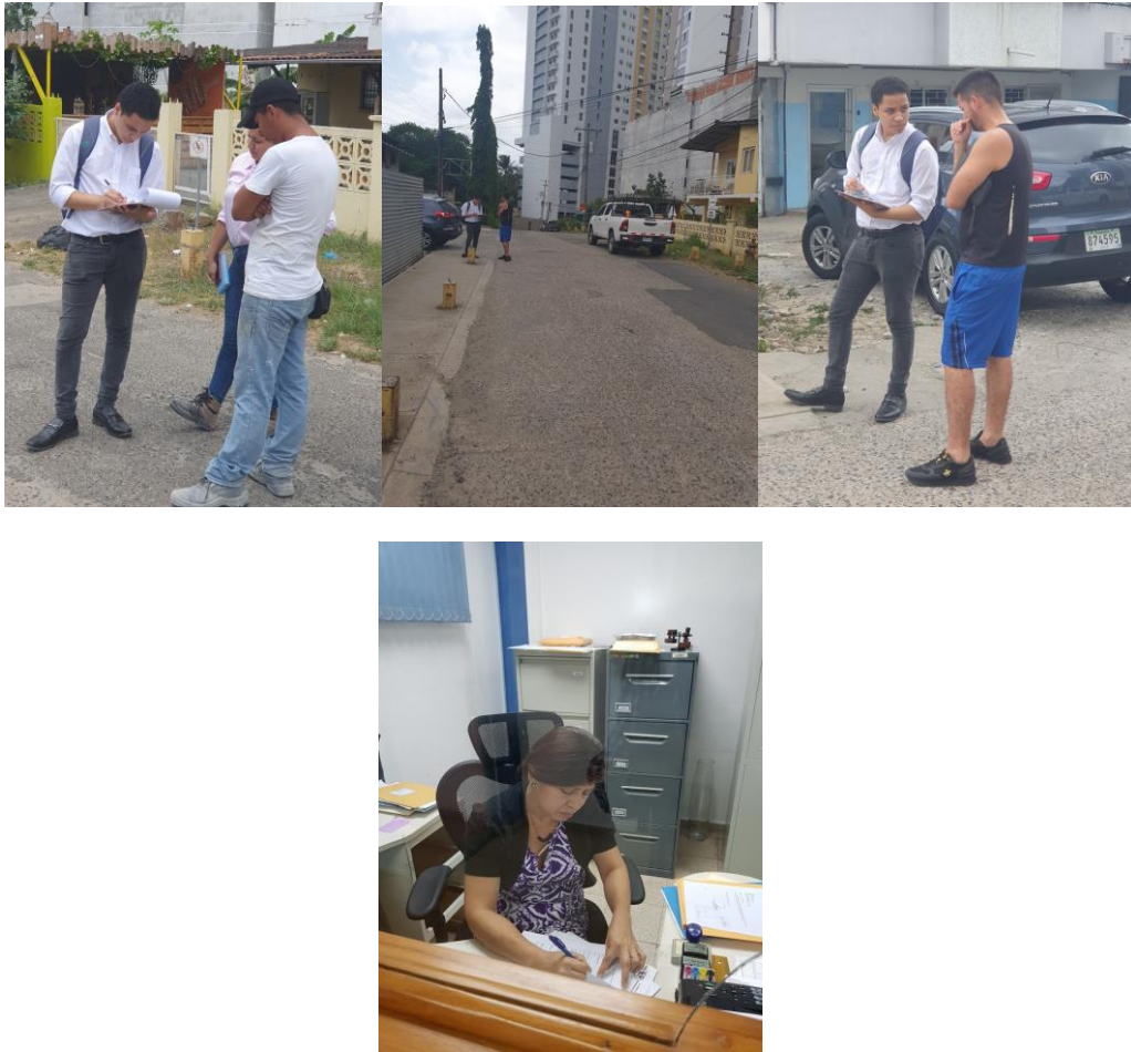
Fotos 3,4,5 Fotos de las encuestas realizadas

Paso 2: Sondeo de Opinión de la Comunidad respecto al Proyecto.