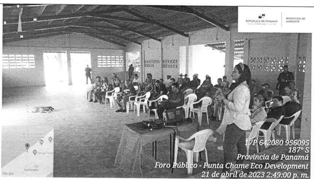
Imagen N° 3: vista de los participantes al foro.