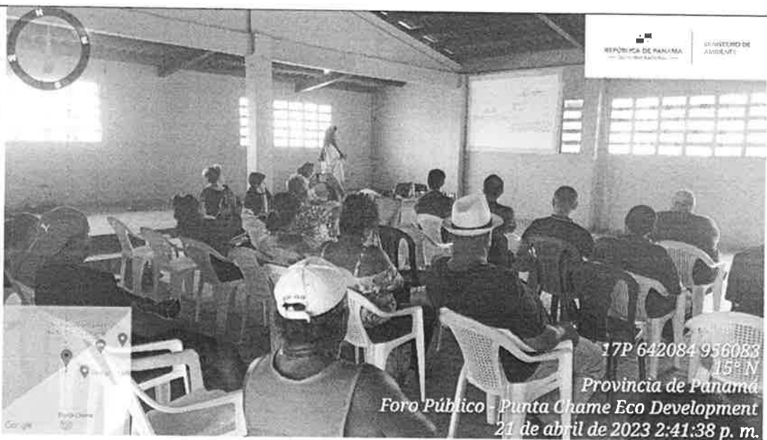
Imagen N° 2: Inicio de la presentación por parte del equipo consultor.