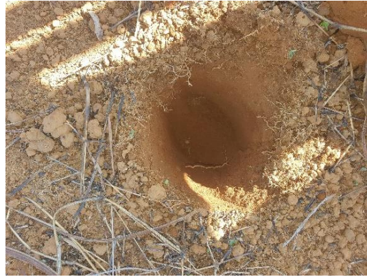
SONDEO N° 2830