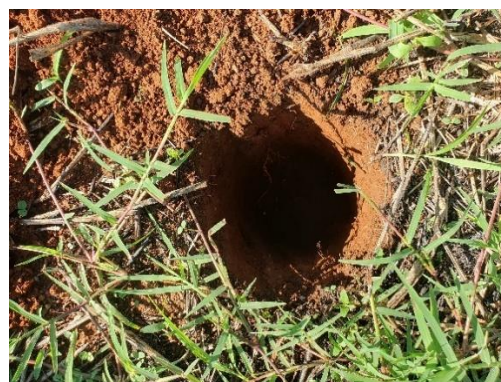
SONDEO N° 2822