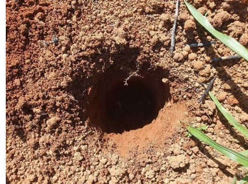
SONDEO N° 2828