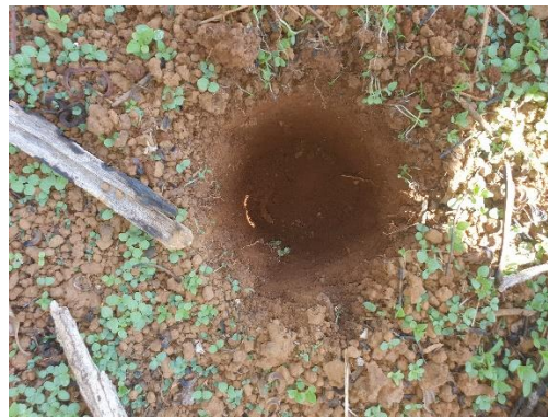
SONDEO N° 2838