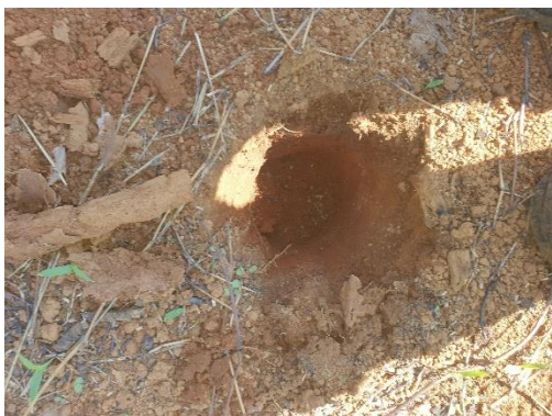
SONDEO N° 2839

No hubo hallazgos arqueológicos en ninguno de los sondeos A continuación, el siguiente cuadro de coordenadas satelitales de la prospección arqueológica: