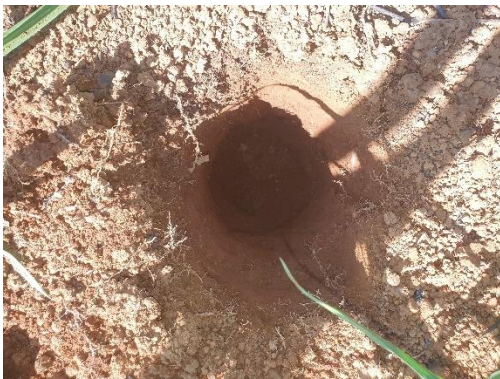
SONDEO N° 2827