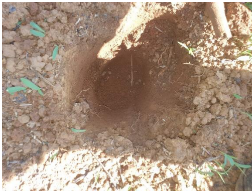
SONDEO N° 2837