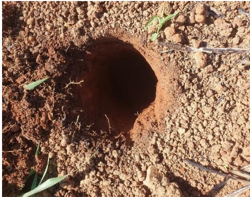
SONDEO N° 2825