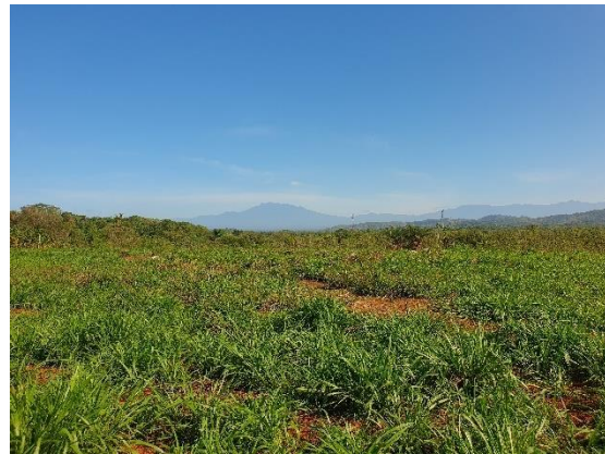
Foto N°3 Vista del tramo Prospectado Foto N°4 Vista del tramo Prospectado