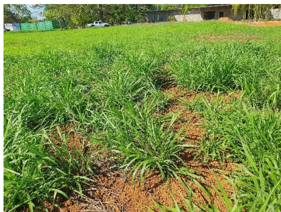
Foto N°7 Vista del tramo Prospectado Foto N°8 Vista del tramo Prospectado