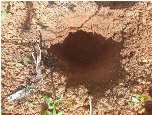
SONDEO N° 2835