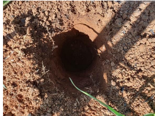
SONDEO N° 2826