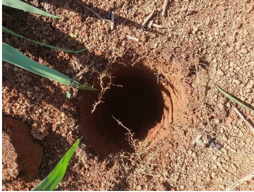
SONDEO N° 2823