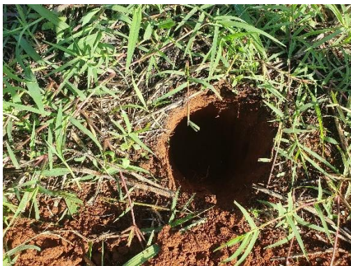
SONDEO N° 2821