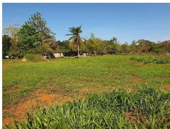
Foto N°5 Vista del tramo Prospectado Foto N°6 Vista del tramo Prospectado

. Área del tramo prospectado, terreno plano tipo potrero con gramíneas, arbustos e individuos arbóreos y desarrollo urbanizado aledaño.