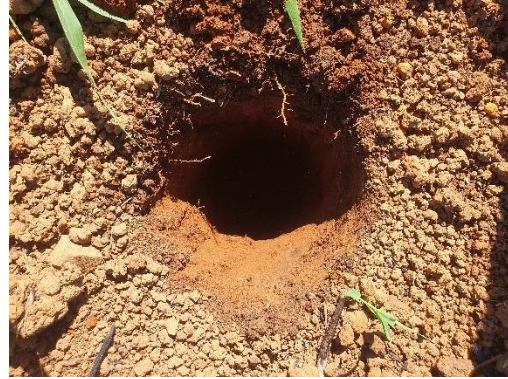
SONDEO N° 2824