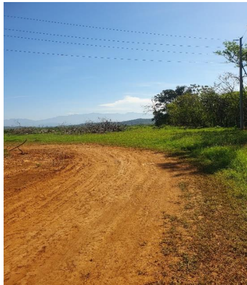
Foto N°13 Vista del tramo Prospectado Foto N°14 Vista del tramo Prospectad