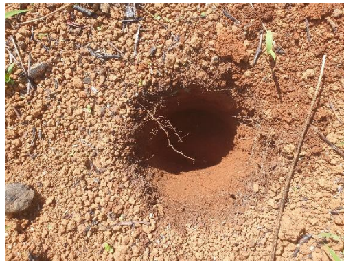
SONDEO N° 2836