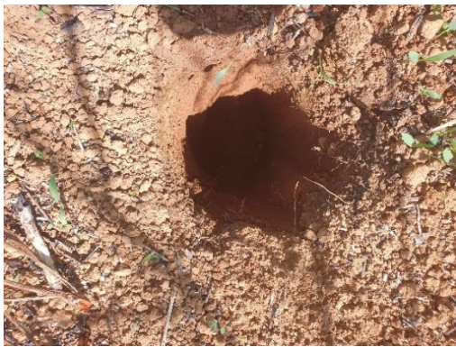
SONDEO N° 2833