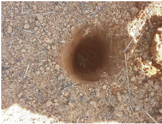
SONDEO N° 2831