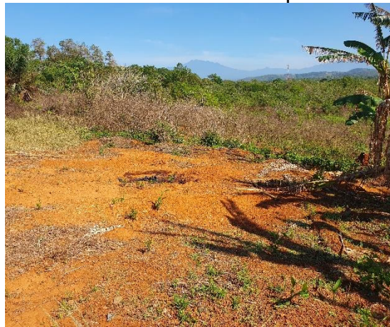
Foto N°11 Vista del tramo Prospectado Foto N°12 Vista del tramo Prospectado