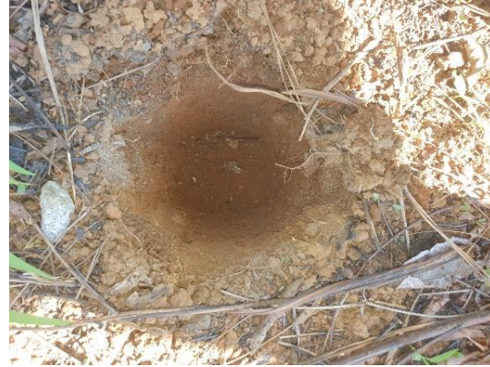
SONDEO N° 2832