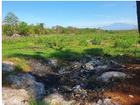
Foto N°9 Vista del tramo Prospectado Foto N°10 Vista del tramo Prospectado