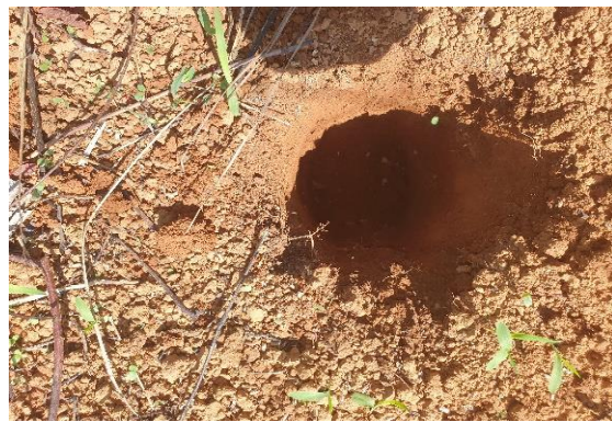
SONDEO N° 2834