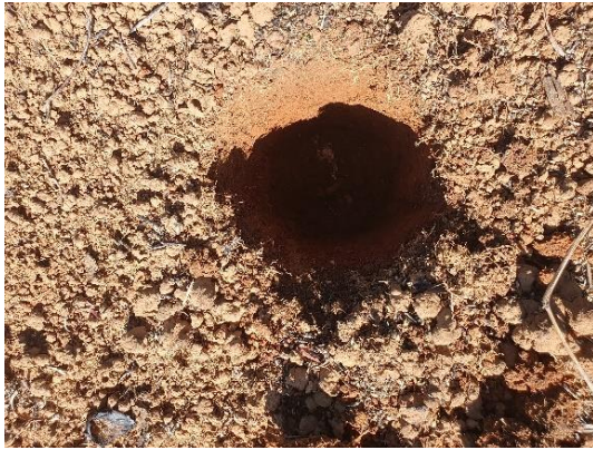
SONDEO N° 2829