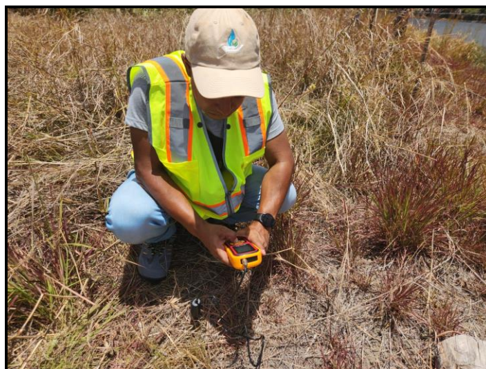
Sitio # 1: Dentro Del Polígono Del Proyecto (Residencia Más Próxima).