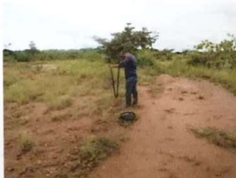
Foto N° 23, 24, 25, 26, 27, 28,, 29 y 30: Vista general. Tramo prospectado. Terreno plano tipo potrero, color arcilloso en algunos sectores. Vegetación compuesta por gramíneas, terreno plano tipo potrero. Aplicación de sondeo.