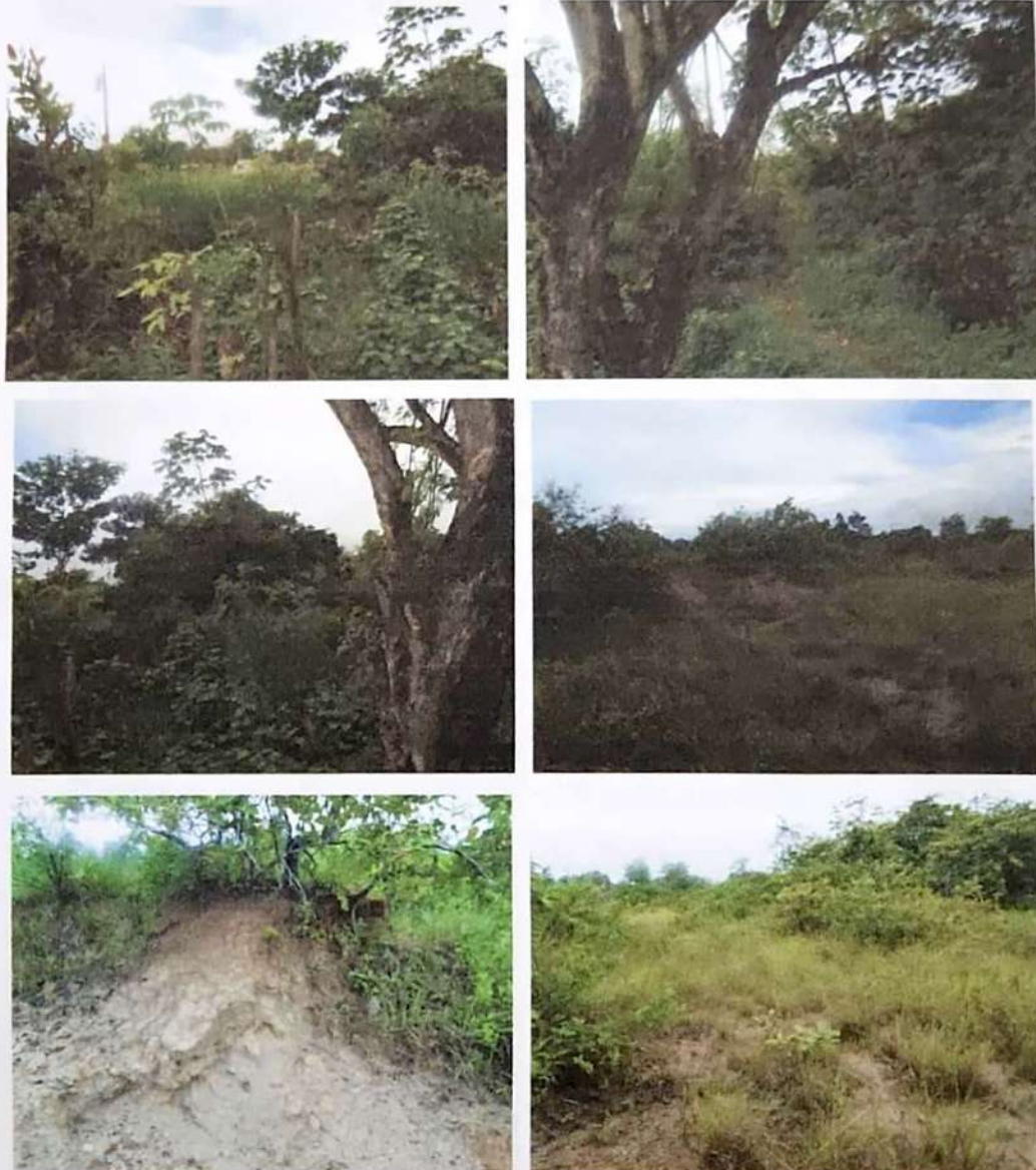
Fotos N° 1, 2, 3, 4, 5 y 6: Vistas generales. Tramo prospectado. Terreno plano tipo potrero, cercano a desarrollo urbanístico residencial. Alterado por desbroce en algunos sectores y con vegetación densa entre herbazales, gramíneas, arbustos y árboles.

El terreno donde se desarrolló esta prospección corresponde a una superficie de 5 Ha. Durante el recorrido se pudo constatar que es un terreno plano tipo potrero cuya vegetación se caracteriza de herbazales, gramíneas, árboles y arbustos. Se utilizaron las zonas propicias para la aplicación de sondeos. Existe una fuente hídrica y se pudo observar zonas inundables y sectores urbanizados aledaños.