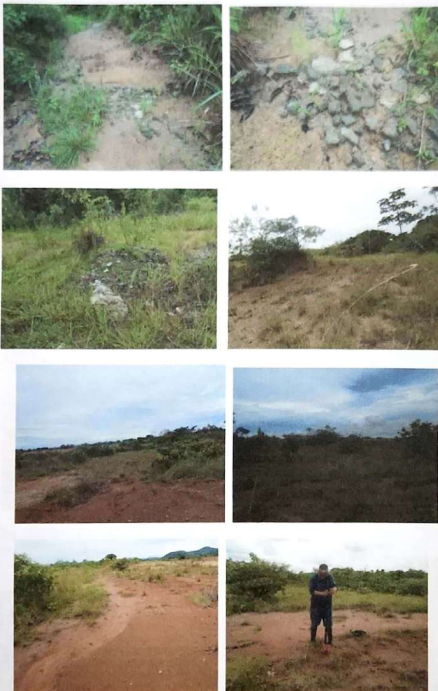
Fotos N° 15, 16, 17, 18, 19, 20, 21 y 22: Vistas generales. Tramos prospectados, terreno plano tipo potrero. Vegetación mixta entre árboles, arbustos, herbazales y gramíneas, en algunos sectores, el suelo se ve de color arcilloso y corrientas de agua que lo alteran a nivel superficial. Se detectó la presencia de escombros de material moderno. Aplicación de sondeo.