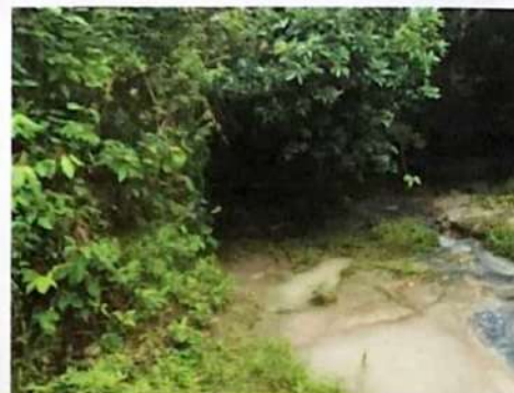
Fotos N° 7, 8, 9, 10, 11, 12, 13 y 14: Vistas generales, tramos prospectados. Terreno plano tipo potrero, alterado, con vegetación mixta entre árboles, arbustos, herbazales y gramíneas, algunas corrientías de agua, zona inundable.