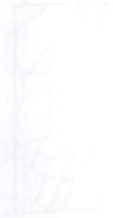
Diagrama de Análisis de Frecuencia