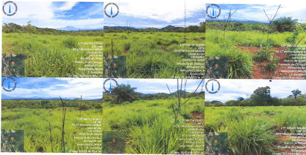
Fig. No. 2: Vistas generales del área donde se llevará a cabo el proyecto propuesto a desarrollar; dichas fotografías fueron tomadas durante la inspección realizada el día 17 de mayo de 2023