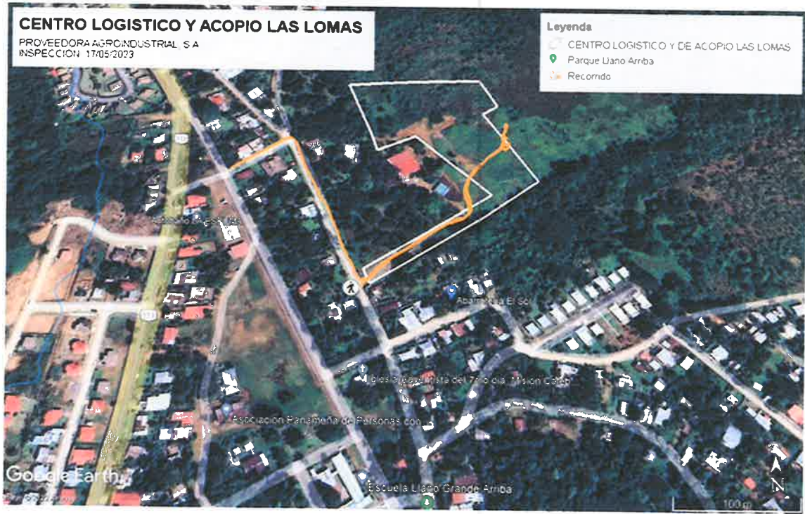
Fig. No. 1: Recorrido realizado el día de la inspección (17 de mayo de 2023); en el cual se puede observar el recorrido realizado al momento de la inspección (línea color naranja, línea de color blanco representa el polígono a impactar por el futuro desarrollo del proyecto presentado en el EsIA