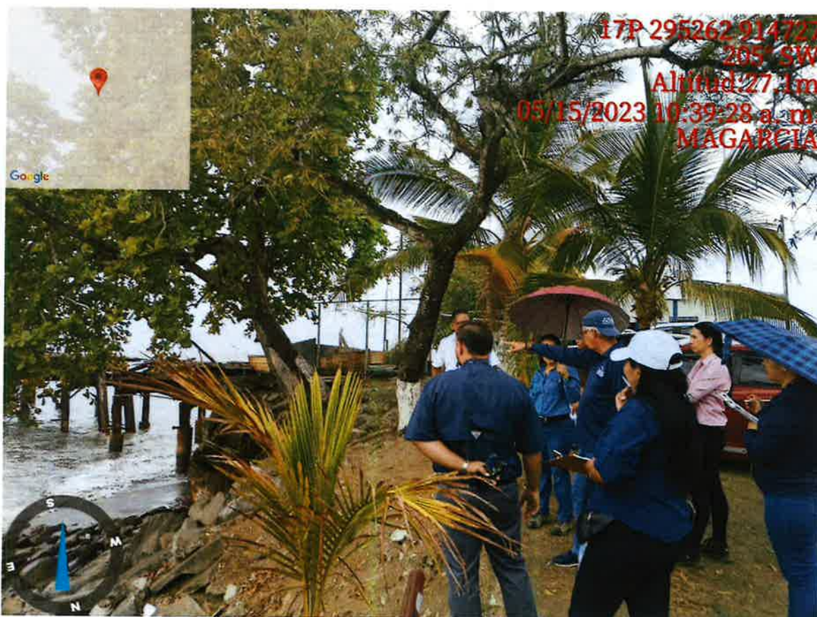
Área señalada por el promotor

17P 295262 914727 205° SW Altitud: 27.1m 05/15/2023 10:39:28 a. m. MAGARCIA