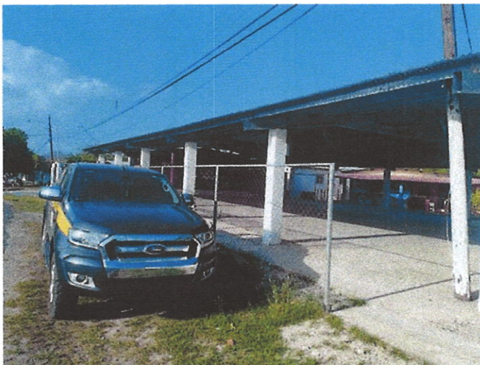
Foto N°2: Vista del vehículo del Ministerio de Ambiente estacionado a un costado Casa Local de Cañaveral “Jardín 20 de Enero”, para constancia de la asistencia de esta institución a dicha reunión.