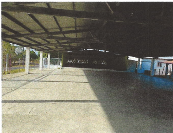
Foto N°1: Vista General de la Casa Local de Cañaveral “Jardín 20 de Enero”, donde se aprecia que no acudio nadie a la reunión.