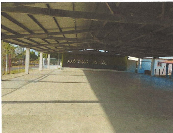
Foto N°1: Vista General de la Casa Local de Cañaveral “Jardín 20 de Enero”, donde se aprecia que no acudio nadie a la reunión.