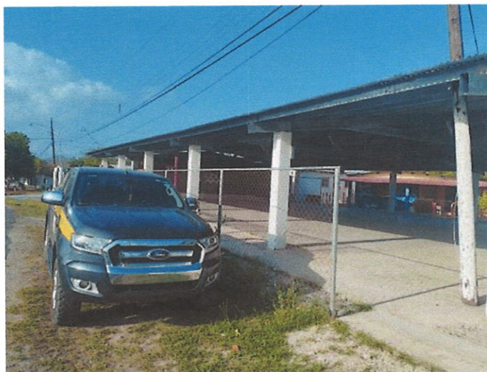
Foto N°2: Vista del vehículo del Ministerio de Ambiente estacionado a un costado Casa Local de Cañaveral “Jardín 20 de Enero”, para constancia de la asistencia de esta institución a dicha reunión.