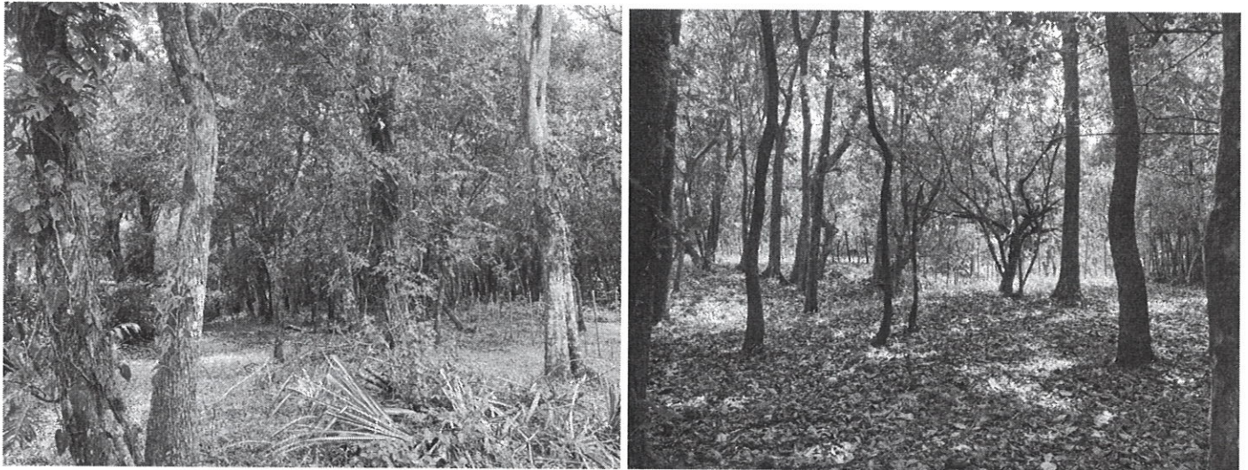
Fig. 1 y 2: Área a desarrollar el proyecto y vegetación del mismo