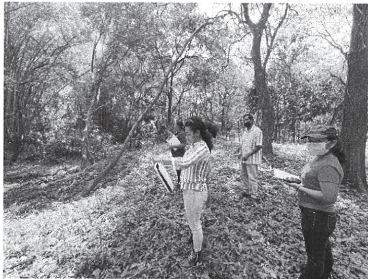
Fig. 3: área cercana a la quebrada sin nombre