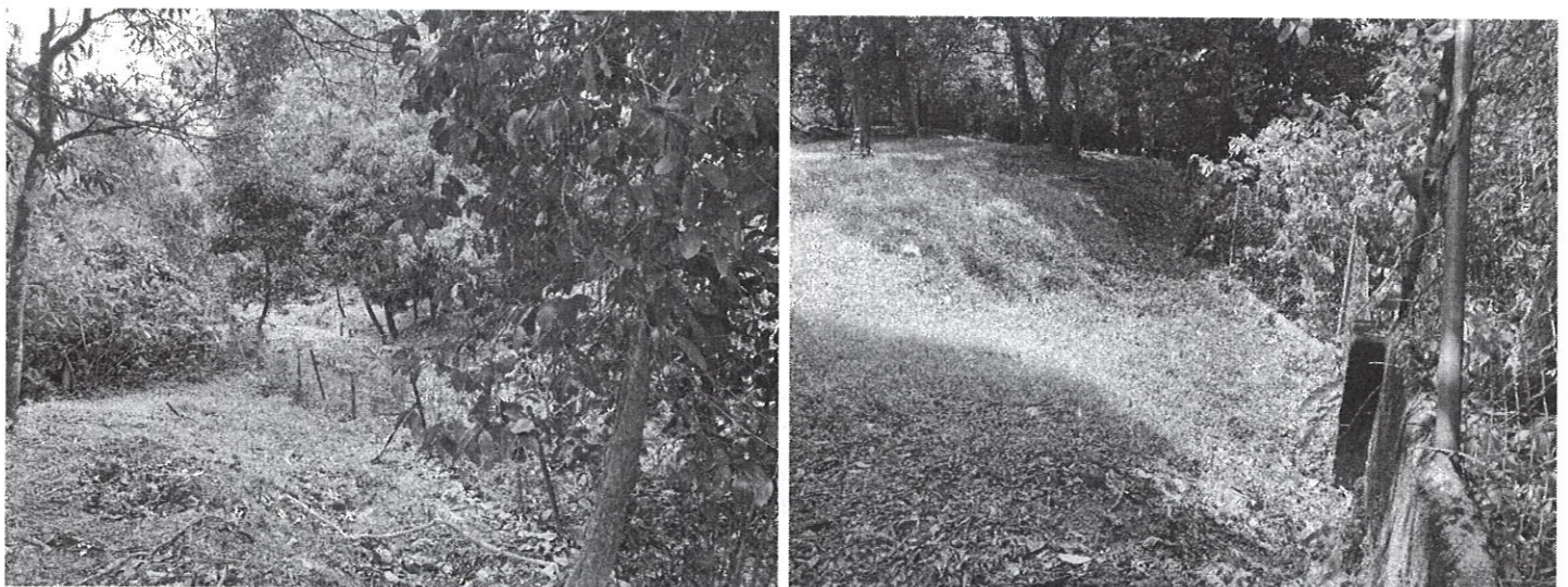
Fig. 4 y 5: quebrada El Embalsadero y lote cercano a la quebrada