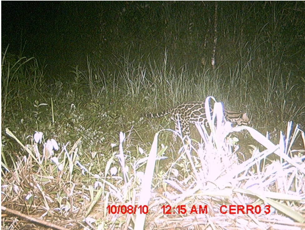
Fotografía 9: Registro MCQSA - Ocelote ( Leopardus pardalis )