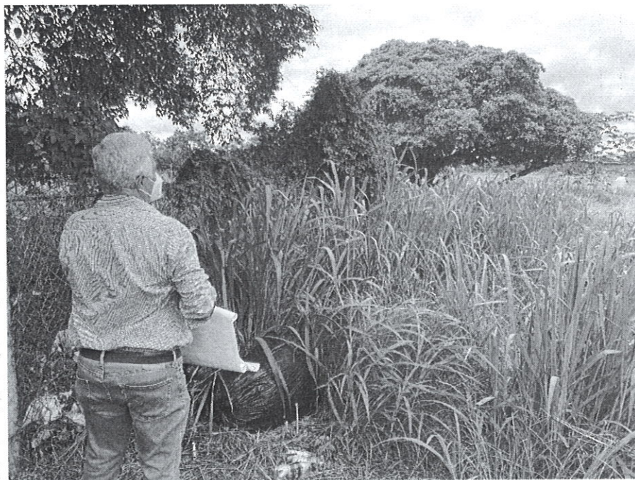
Foto 1: inicio del área de Proyecto, se puede evidenciar la presencia de basura.