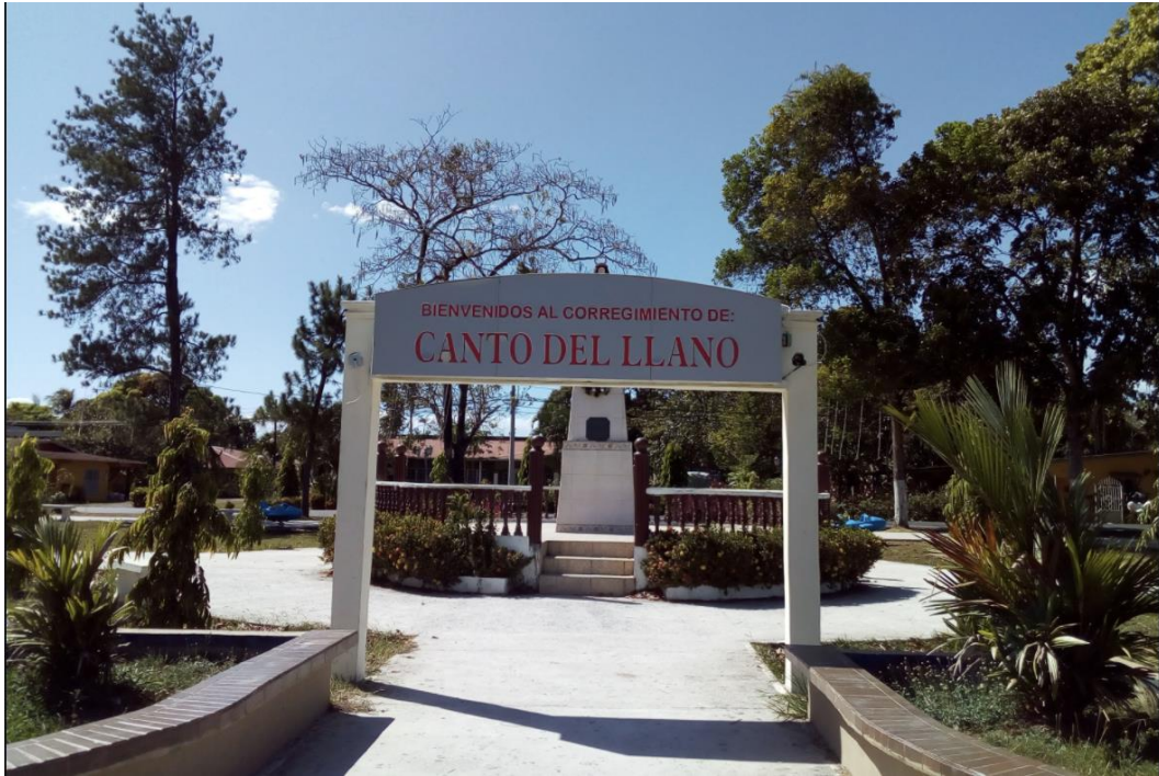
Ilustración No. 4. Vista del parque de la zona