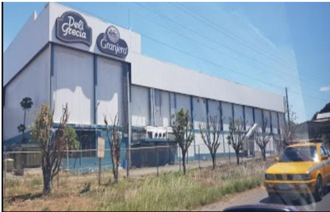
Ilustración No. 5. Vista de una de las industrias de la zona