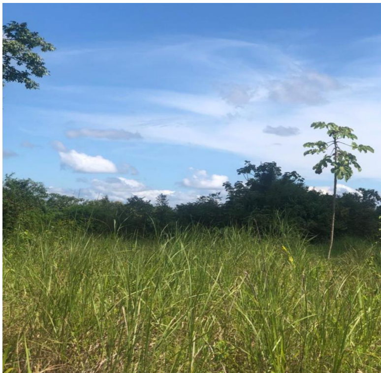
Ilustración 10. Vista del terreno a desarrollar

Los terrenos del promotor, y las fincas vecinas no escapan de esta realidad; el polígono en donde se ha delimitado la residencial, tiene puntos con elevaciones bajas. El terreno a desarrollar podría describirse como una planicie que favorece las intenciones del desarrollo.