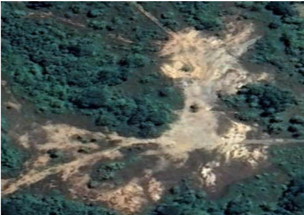
Ilustración 2. Vista del terreno a desarrollar

El área, es propiamente lo que se conoce como una comunidad urbana, en donde se observan gran cantidad de viviendas unifamiliares, intercaladas con pequeñas industrias y comercios propios de centros de la periferia urbana.