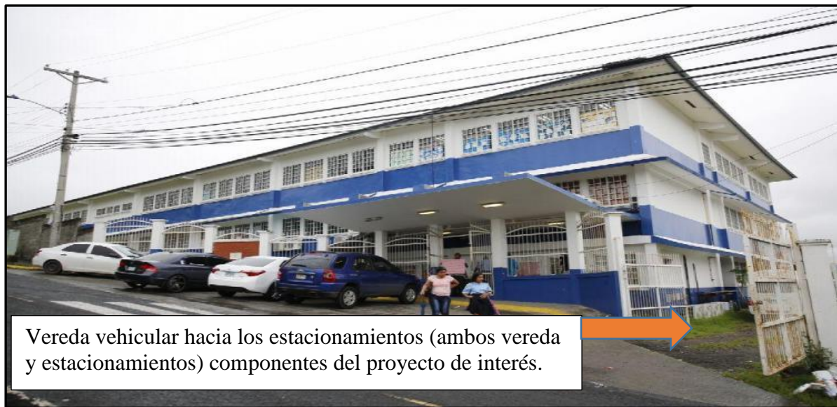
Fotografías N° 2. Vistas, del espacio destinado a vereda o calle hacia los estacionamientos

La maquinaria y equipo que utilizar será proporcionado por empresa contratista, entre ellos: Compresores, Soldadoras, equipo rodante (Camiones de volquetes y vehículo pick up), escaleras, Máquinas pulidoras y/o cortadoras de disco y Otros (cepilladora, taladros, taladro horizontal para acoplos, taladro para atornillar, sierras, radial, roter y juego de cuchillas, lámparas, guillotinas, pegamento).