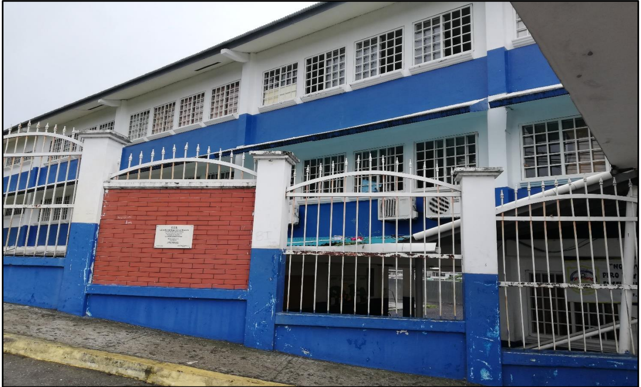
Fotografías N° 1. Vistas, de las estructuras existentes del C.E.B.G. Santiago de La Guardia.

Estudio de Impacto Ambiental- Categoría I. Proyecto “Diseño, desarrollo de planos y construcción de nuevo pabellón de planta baja y nivel alto, que consta de 16 aulas de clases, baterías de servicios sanitarios, ampliación del patio de saludo a la bandera, construcción de muros de contención, áreas de estacionamientos, calle de acceso al C.E.B.G., Santiago de la Guardia, ubicado en el corregimiento Omar Torrijos, distrito de San Miguelito, provincia de Panamá.