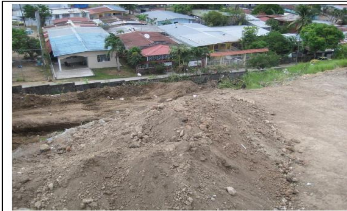
Fotografías N°3. Vistas, del estado del suelo del polígono de interés, posterior al relleno llevado por la empresa constructora, a quien, en el año 2014, se le asignó la construcción del proyecto que hoy nos ocupa.