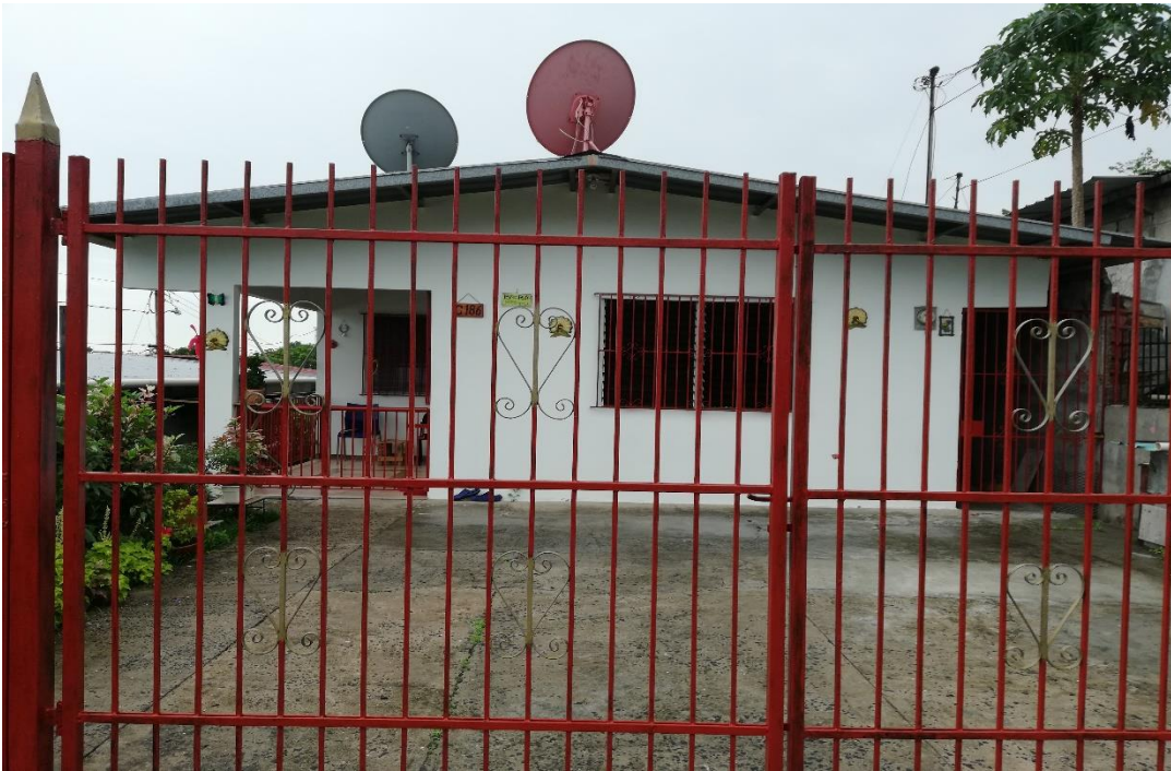
Fotografías Nº 4. Vista. Evidencia de participación ciudadana.