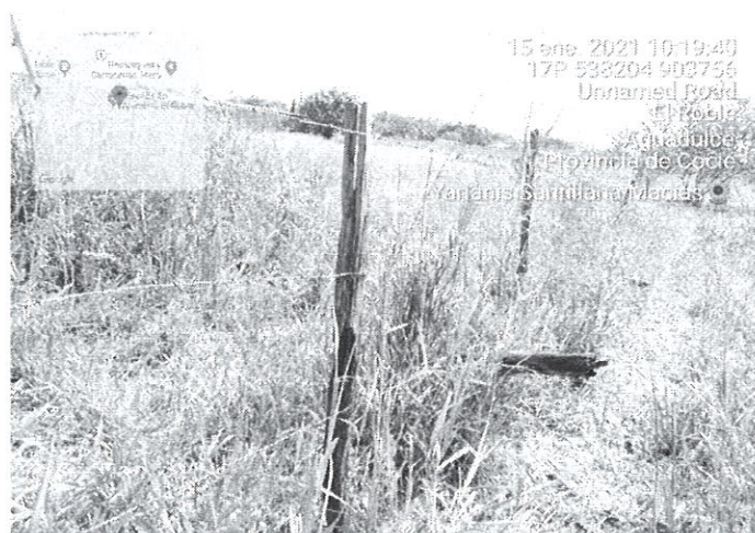
Fig. 1 y 2. Área propuesta para el desarrollo del proyecto