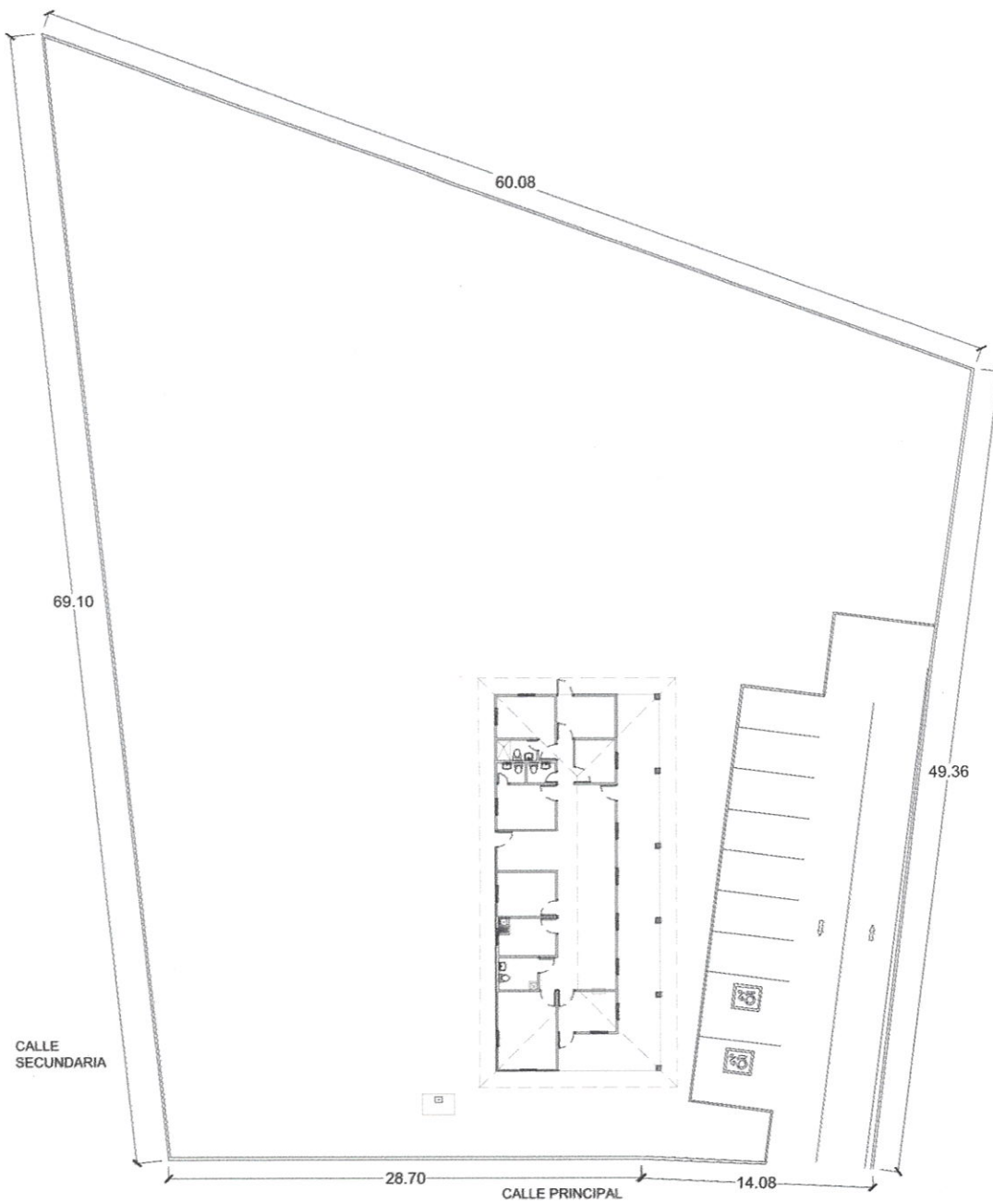
PLANTA GENERAL ESC. 1:350

Polígono de proyecto (proporcionado por el promotor)