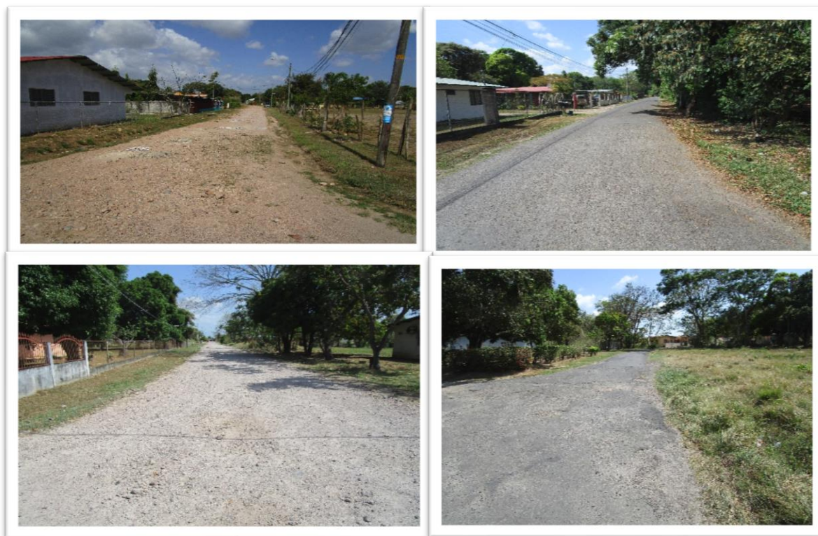
Calles a rehabilitar en Las Lomas y Pueblo Nuevo