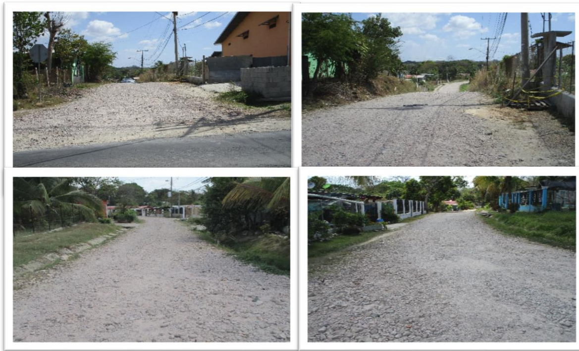
Calles la Guacherna a rehabilitar