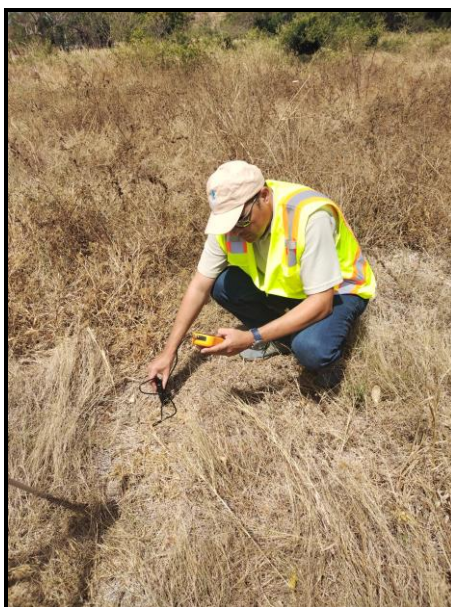
Sitio # 1: Dentro Del Polígono Del Proyecto.