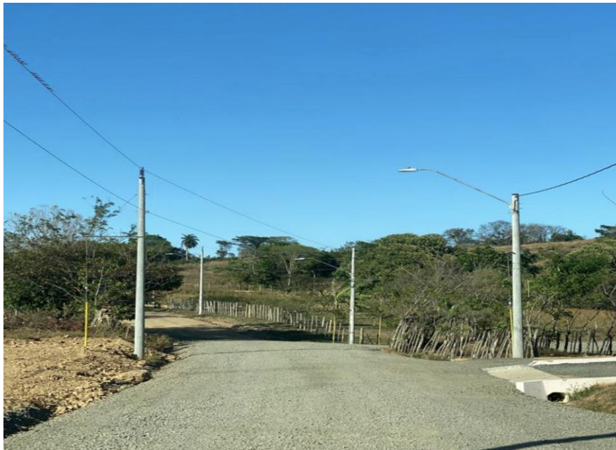
Ilustración 9. Vista de la servidumbre principal del lugar

Los terrenos del promotor, y las fincas vecinas no escapan de esta realidad; el polígono en donde se ha delimitado la residencial, tiene puntos con elevaciones bajas. El terreno a desarrollar podría describirse como una planicie que favorece las intenciones del desarrollo.