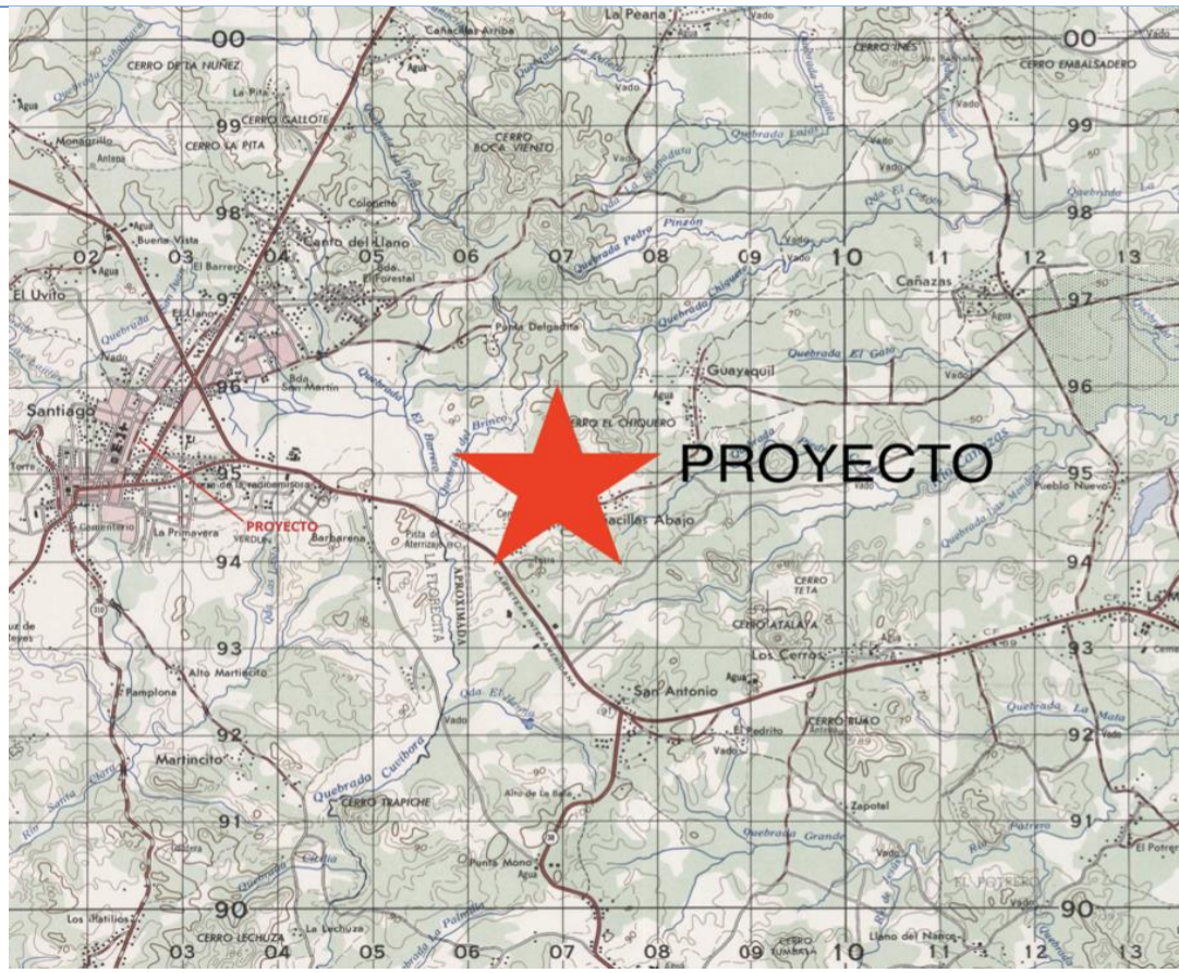
Ilustración No.3 . Extracto, sin escala, de la localización 1 en 50 mil, ubicada en el Anexo 2 del Estudio.