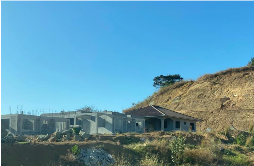
Ilustración No. 4. Vista de la Etapa 1, ya aprobada.