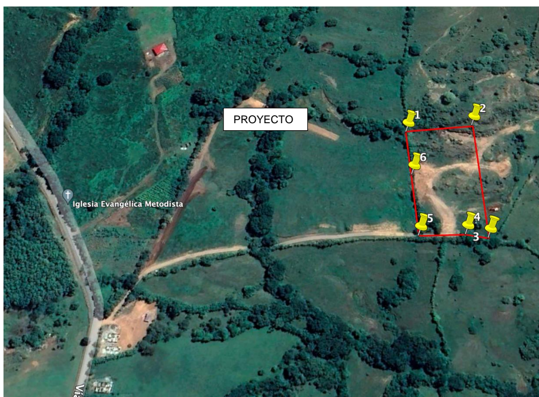
Ilustración 2. Vista del terreno a desarrollar

El área, es propiamente lo que se conoce como una comunidad peri urbana, en donde se observan gran cantidad de viviendas unifamiliares, intercaladas con pequeñas industrias y comercios propios de centros cercanos a ciudades.