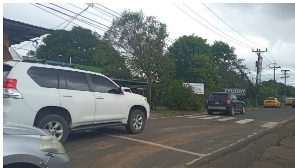
Ilustración 10. Vista general del paisaje del área del proyecto.