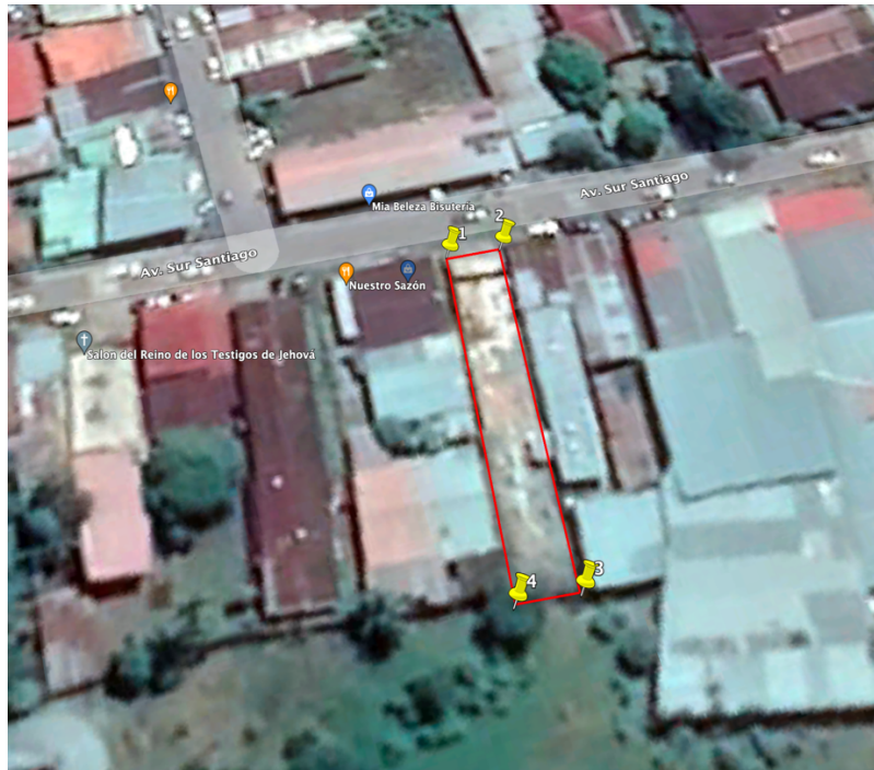
Ilustración No. 2. Ilustración de Puntos desde Google Earth