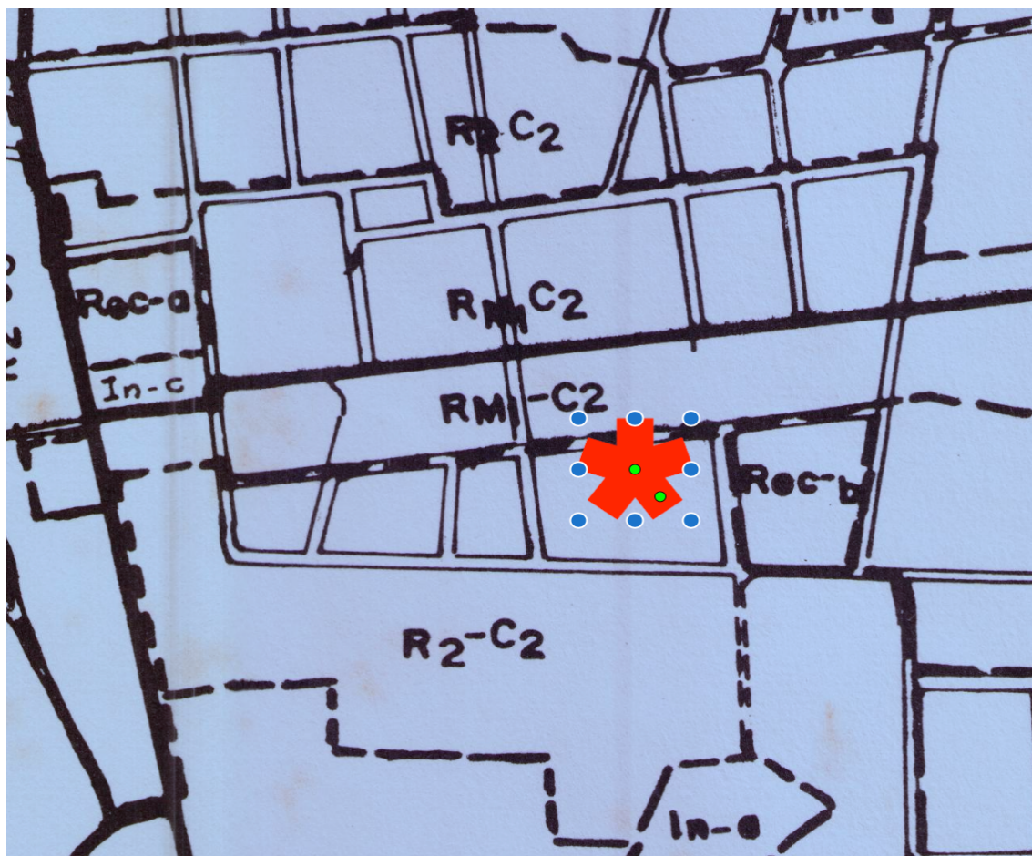
Ilustración No. 3. Vista del Plano del Plan Normativo de Santiago, con el uso de suelo destinado al lote.

En el Anexo 2, se encuentra el plano y detalle del Plan de Normativo de la Ciudad de Santiago, que data de 1978, que para el lote indica que existe una zonificación denominada RM1 (Residencial Multifamiliar de Alta Densidad)- C2 (Comercial Urbano Central), y que describe lo siguiente: