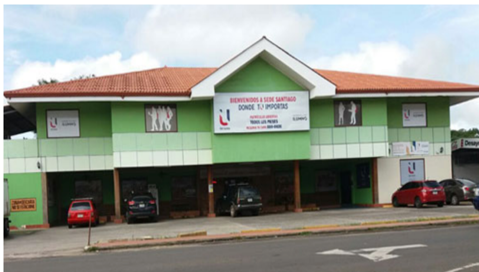
Ilustración No. 4. Vista de local comercial contiguo en Avenida Sur