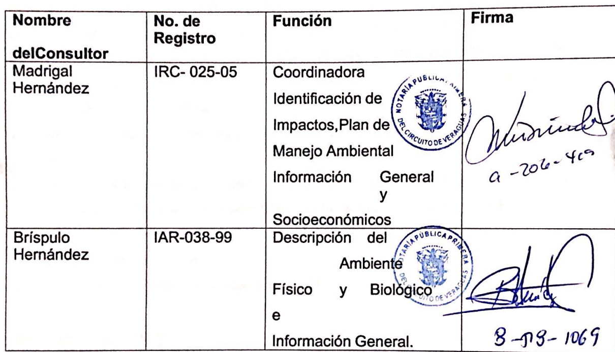
Cuadro No. 10. Profesionales, número de Registro, funciones y firma.

Los números de registro de los consultores se presentan en el punto anterior.