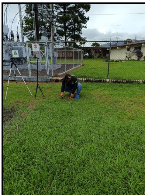
Punto # 1: SUB-ESTACIÓN VOLCÁN