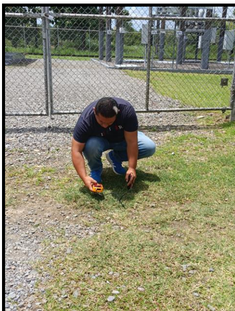
Sitio # 1: SUB-ESTACIÓN EL PORVENIR