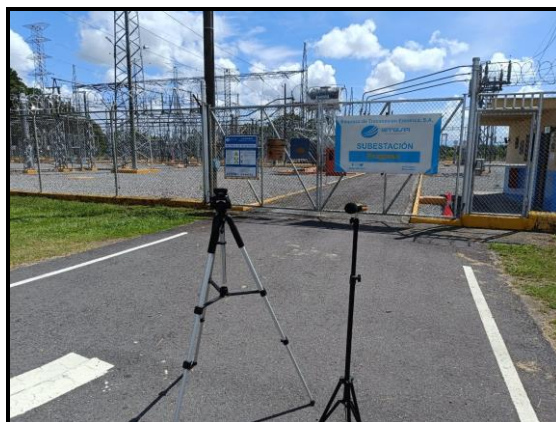
Punto # 1: SUB-ESTACIÓN PROGRESO