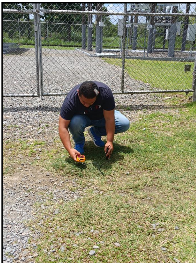
Sitio # 1: SUB-ESTACIÓN BUGABITA