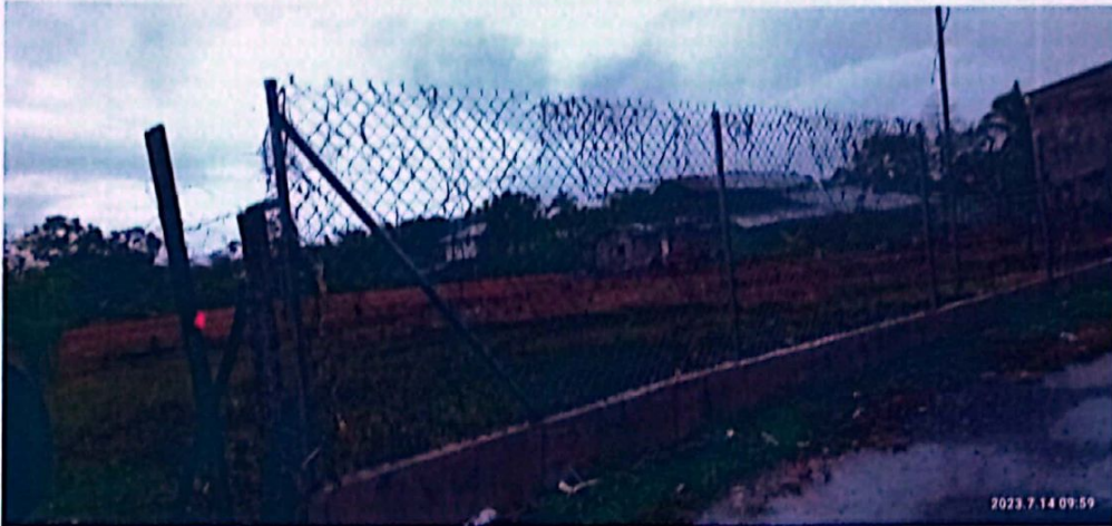
Figura No.2 Evidencia de que el Proyecto no ha iniciado sus actividades (Vista Lateral).