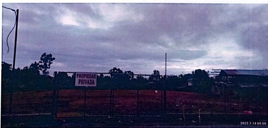
Figura No. 1. Vista frontal del Ambiente Físico, donde se desarrollará el Proyecto.