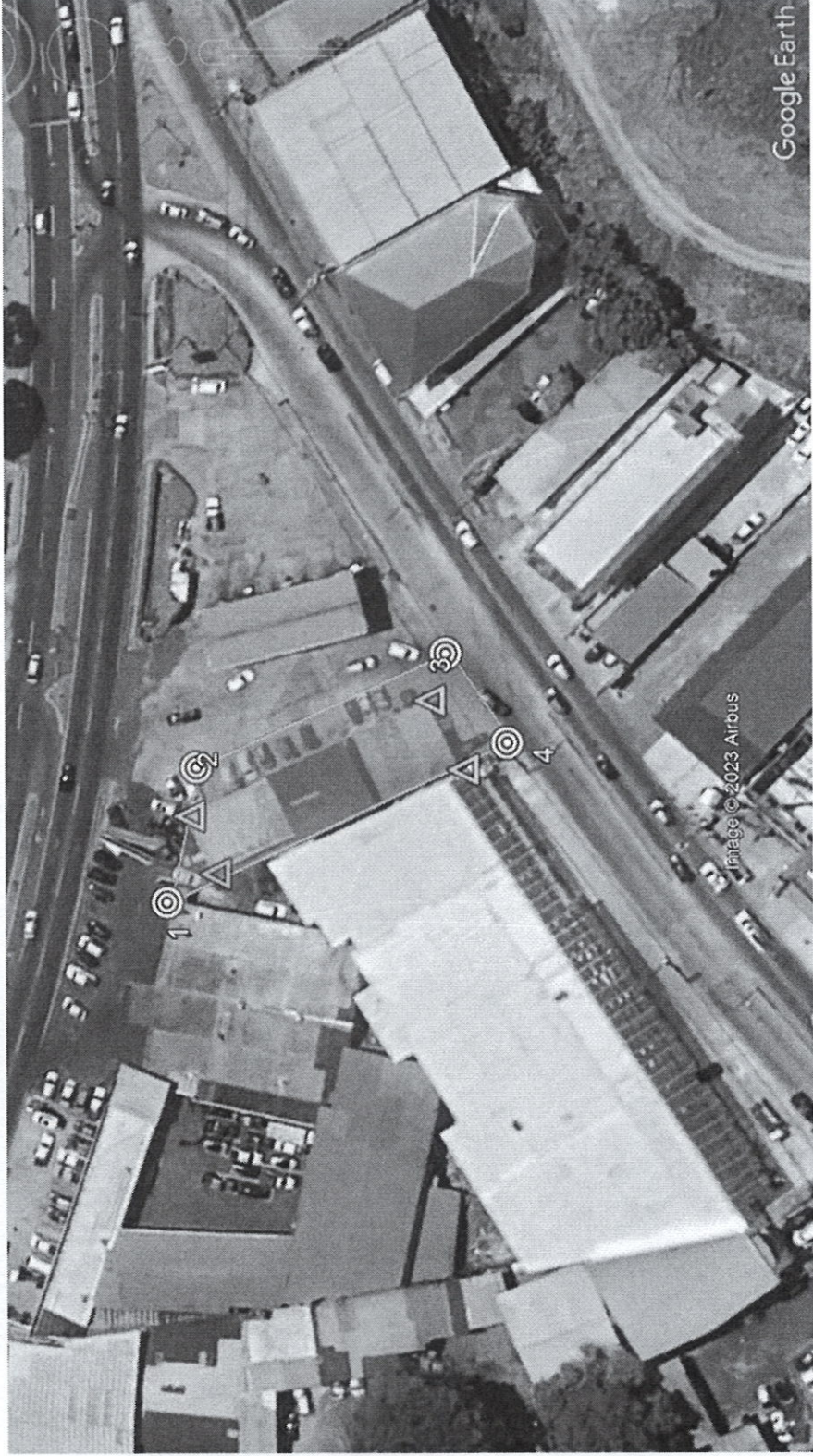
Ilustración 4: Se muestran coordenadas del Es.I.A. y datos obtenidos en campo del perímetro de la estructura existente (puntos color celeste) Vista satelital del proyecto tomada del software Google Earth

Fuente: Inspección realizada el 02/10/2023