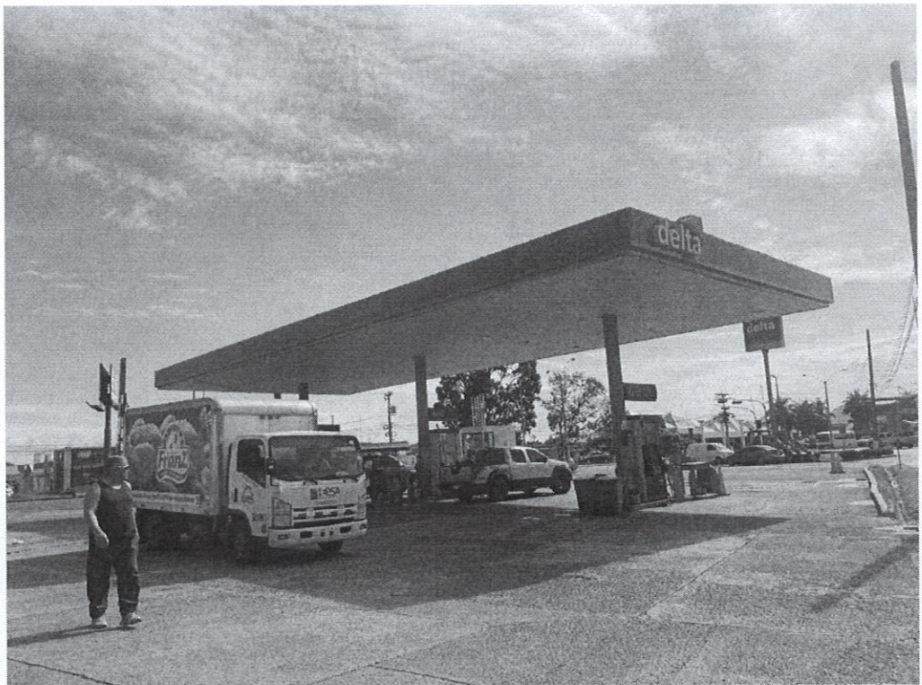
Ilustración 3: Estación de combustible DELTA a un costado del área del proyecto