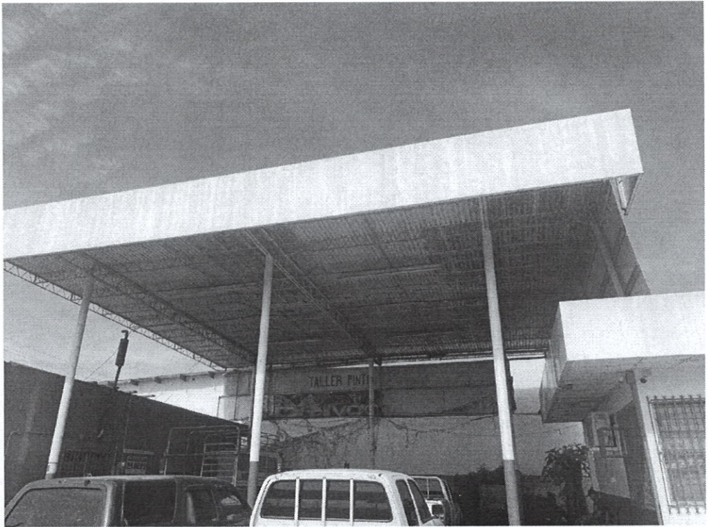
Ilustración 2: Taller alquilado a terceros