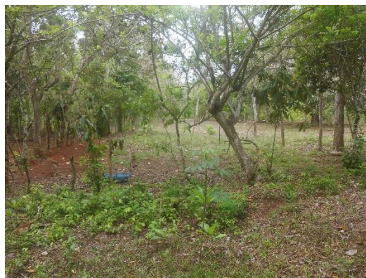
Fotos 1, 2, 3 Entrada al área del proyecto