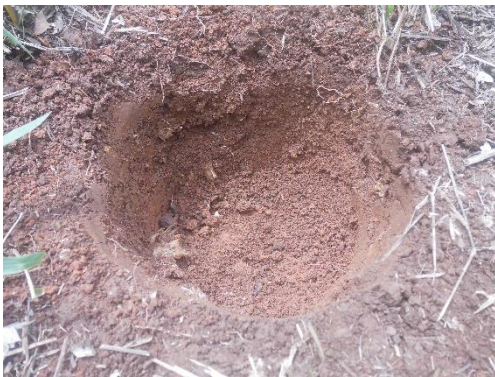
Fotos 24, 25, 26, 27, 28, 29, 30 Pruebas de sondeo en polígono. No hubo hallazgos culturales en los sondeos.