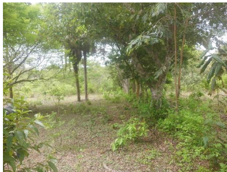
Fotos 4, 5, 6, 7, 8 Vistas del polígono el proyecto prospectados; siembras y área de ganadería