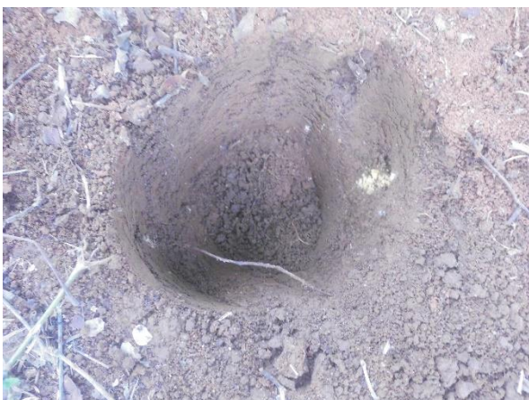
Fotos 15, 16, 17, 18 Pruebas de sondeo en polígono