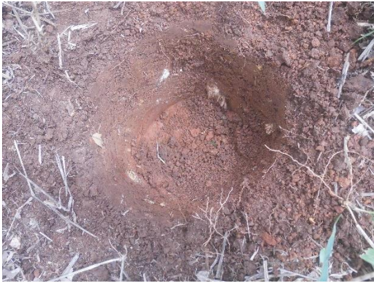
Fotos 19, 20, 21, 22, 23 Pruebas de sondeo en polígono