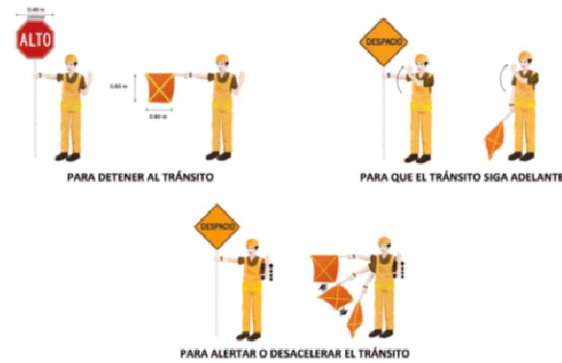
ESQUEMA DE SEÑALES MANUALES A IMPLEMENTAR POR LOS BANDERILLEROS

-SE UTILIZARAN BANDERILLEROS EN CADA PUNTO DE ENTRADA, SALIDA Y ZONA DONDE LOS CAMIONES REALIZARAN LAS MANIOBRAS DE RETROCESO DE MANERA QUE, SE GARANTICE LA SEGURIDAD DE LOS PEATONES, PERSONAL DE CAMPO, Y VEHICULOS PARTICULARES -SE APLICARÁ LO ESTIPULADO EN EL MANUAL DE ESPECIFICACIONES TÉCNICAS DE SEGURIDAD VIAL DEL MINISTERIO DE OBRAS PÚBLICAS (MOP).