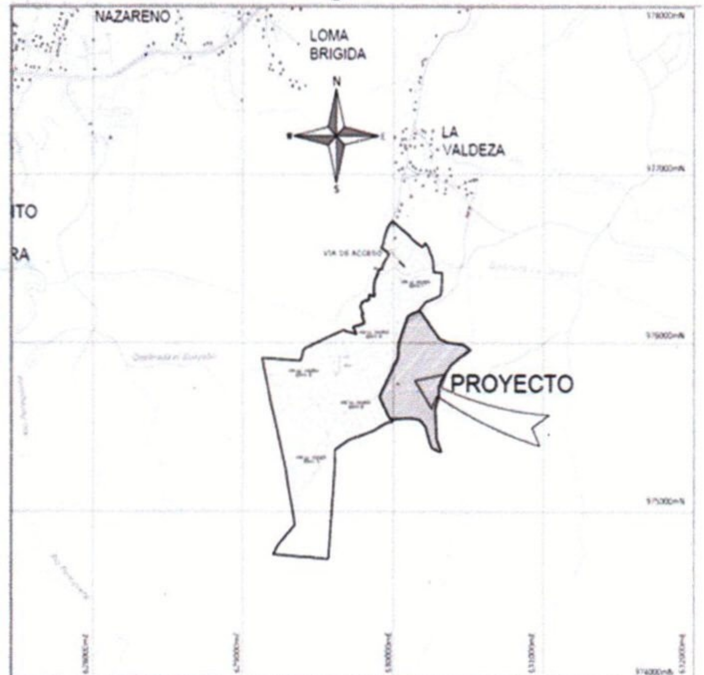
LOCALIZACIÓN REGIONAL ESC. 1:25000

Email de contacto: orc@grupoti.com Página Web: https://lavaldeza.com