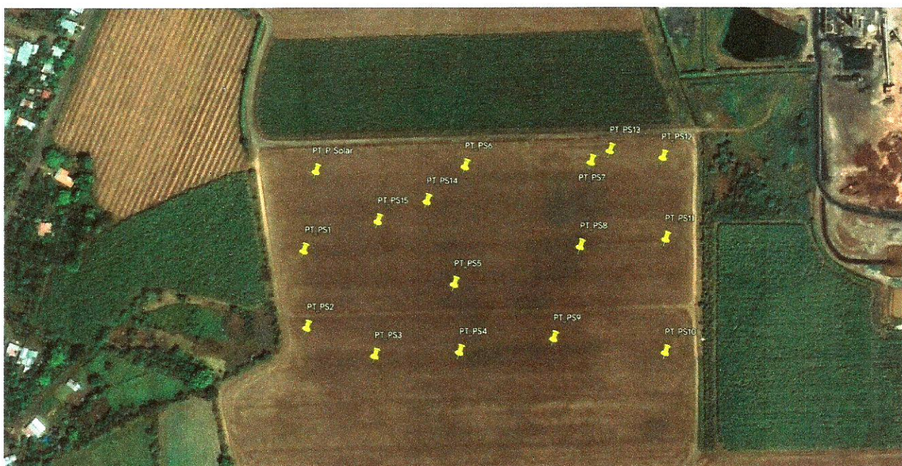
Vista Satelital del proyecto “PROYECTO EL TEJAR”