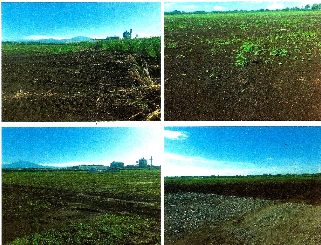
Fotos No.1, 2, 3, 4, 5, 6, 7 y 8. Vistas generales. Tramo prospectado. Terreno plano e área rural dominada por estratos de tierra y atas de hierba. Presenta pavimento antropogénico, aledaña a estructuras de concreto habitadas.