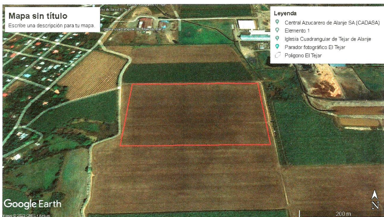
PLANO DEL ÁREA DEL PROYECTO “PROYECTO EL TEJAR”