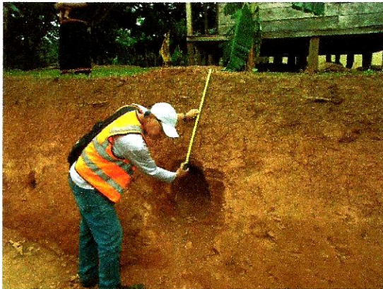
Foto A Toma de medidas de rasgo arqueológico. Observe detalles del perfil de corte en pared en cual se observa un segmento de la vasija.

contemporaneidad cronológica entre ambas, sólo que en muy bajísima densidad artefactual; el estrato cultural en ambas unidades oscilaba entre 10cm-40cm); por debajo del mismo se observaron niveles de matrices de arcillosas compactas hasta el nivel estéril de suelo” ( MORA 2020-2021: DISEÑO Y CONSTRUCCIÓN DE CAMINOS DEL DISTRITO DE BESIKÓ (CPA) (SAN JUAN) - CIENEGUITA - QUEBRADA HACHA - LAJERO - ALTO POTRERO Y RAMAL HACIA CAMARÓN ARRIBA), COMARGA NGÄBE BUGLÉ, PROVINCIA DE CHIRIQUÍ).