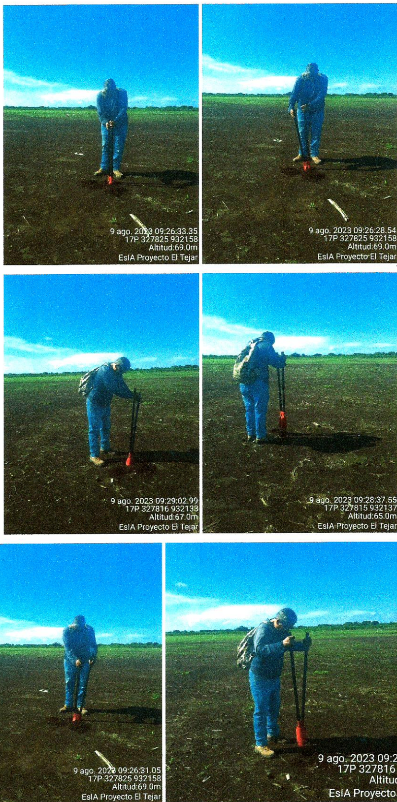
Fotos N° 9, 10, 11, 12, 13 y 14. Vistas Generales. Área del tramo prospectado, aplicación de sondeo.