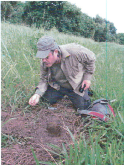
Foto No. 5 Tamizaje en sondeo