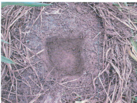
Foto No. 8 Sondeo en coordenadas 0623867 0969460