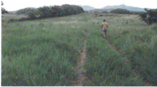
Foto No. 3 Trayecto prospectivo en lote del proyecto