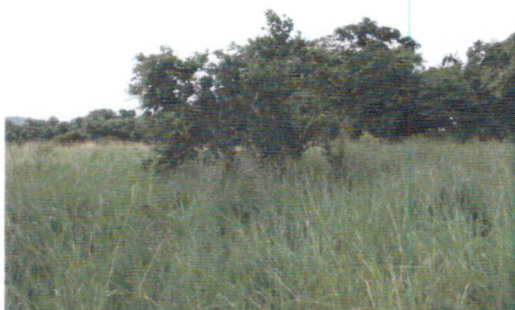
Foto No. 6 Vista de paisaje en lote de proyecto