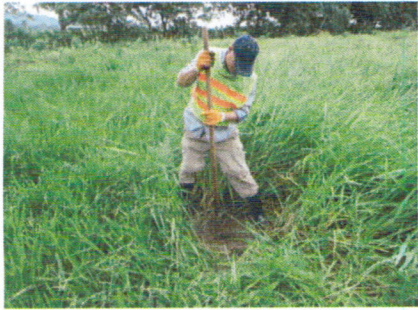
Foto No.9 Prospección en polígono