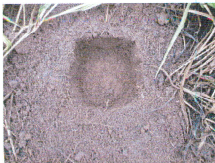
Foto No. 12 Sondeo en polígono