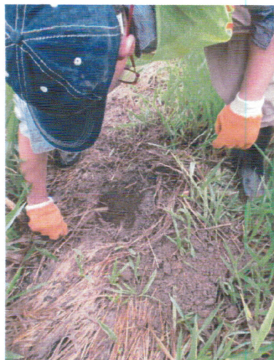
Foto No. 7 Prueba de sondeo