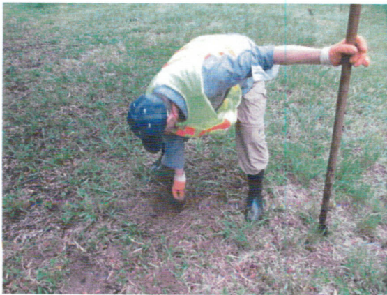
Foto No. 2 Fase prospectiva en proyecto