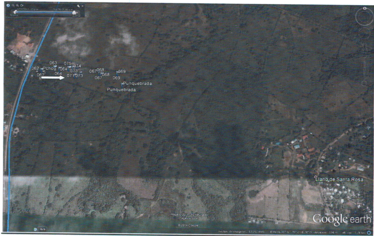
Foto A Ubicación y recorrido del polígono del proyecto