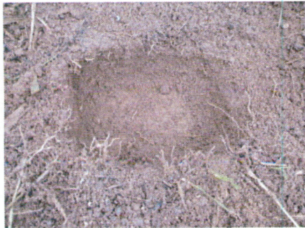
Foto No. 10 Sondeo en polígono