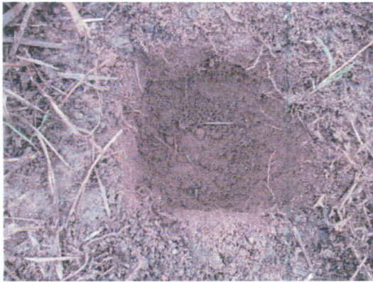
Foto No. 4 Sondeo en coordenadas 0623608 0969489