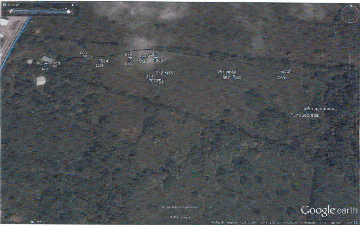
Foto B Registro prospectivo de coordenadas en polígono del proyecto