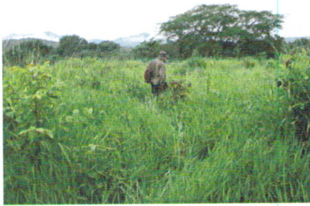
Foto No. 11 Prospección en polígono