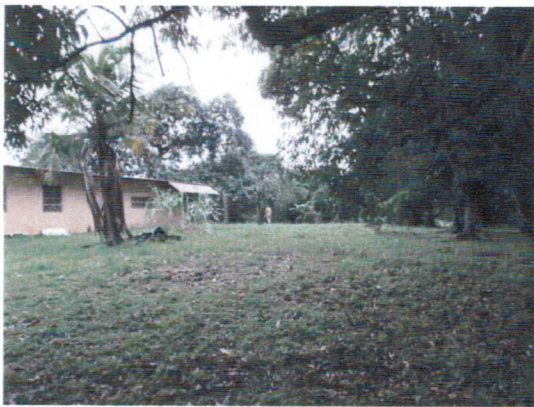
Foto No. 1 Entrada al polígono del proyecto

El área prospectada está ubicada en zona de potrero la cual colinda con otros lotes de terreno en igual condición. Su superficie es de 14 has + 8, 820 M2. Se describen huellas de actividades domésticas de siembra y ganadería vacuna. El lote del terreno es plano, con relativa densidad vegetal en varios tramos. Durante los sondeos se describió suelo arcillo-arenoso desde el Horizonte A hasta los 30 cm (0cm-30cm), cambiando a chocolate semi oscuro- de 30cm-50cm; siendo así consistente durante el recorrido, además; los sondeos efectuados no arrojaron evidencias culturales a lo largo de su distribución aleatoria por los distintos cuadrantes del polígono.